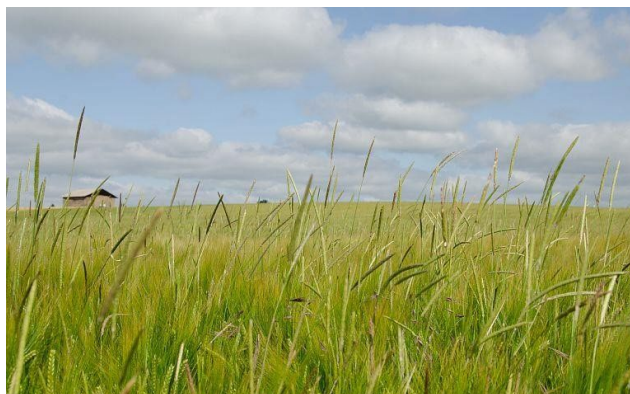
Photo 1: Vulpin, une adventice résistante présente dans le Berry. Photo 2: Rotation de 9 ans évaluée sur la plateforme Syppre Berry intégrant des cultures de printemps.

Ce type de rotation intégrant des cultures de printemps adaptées à la région peut réduire la pression adventice tout en réduisant l'empreinte environnementale et en apportant des avantages économiques. La diversification des espèces et des dates de semis, l'implémentation de couverts et la réduction du travail de sol participent aussi à l'amélioration très nette de la gestion des adventices. Les projections sur dix ans ont montré (i) une réduction de l'utilisation d'herbicides de 35% ; (ii) une réduction des émissions de gaz à effet de serre de 32% ; et (iii) grâce à l'introduction de cultures à haute valeur ajoutée et une augmentation des marges nettes de 12%.