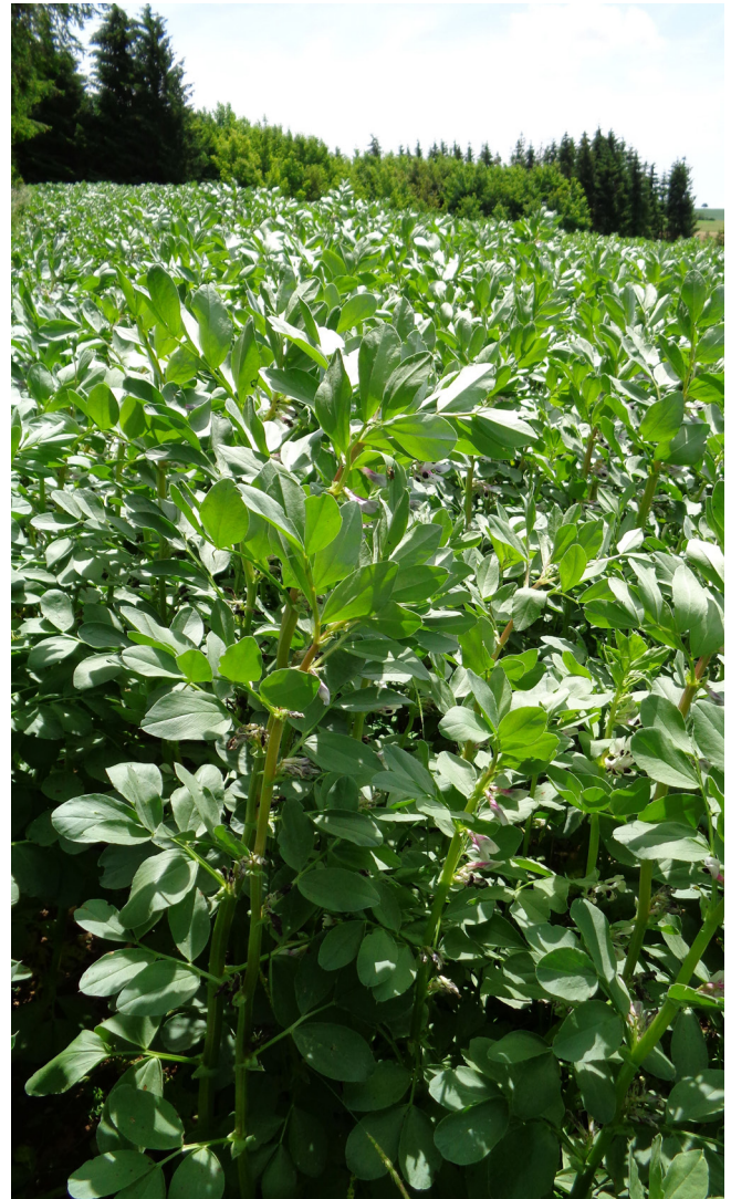
Ackerbohne hat einen hohen Wasserbedarf.

Klimatische Veränderungen verlängern den Zeitraum, in dem die Pflanzen photosynthetisch aktiv sind. Höhere Wärmesummen können bei ausreichender Wasserversorgung positive Auswirkungen auf Pflanzenentwicklung und Ertragspotential haben. Extremwetterereignisse wie Hitze, Trockenheit, Starkregen, Stürme und Hagel nehmen jedoch zu. In den vergangenen 70 Jahren ist die Anzahl der heißen Tage (max. Temperatur >30^{\circ}\text{C} ) in Deutschland im Mittel von drei auf zehn Tage pro Jahr gestiegen. Trockenheit reduziert die Photosyntheseleistung und vermindert das Pflanzenwachstum. Besonders betroffen sind Regionen wie der Nordosten Deutschlands mit leichten Böden und geringer Wasserspeicherkapazität. Die mittleren Niederschlagssummen sind regional jahreszeitlich unterschiedlich. Neben der Niederschlagssumme ist auch die Niederschlagsverteilung ausschlaggebend für ein optimales