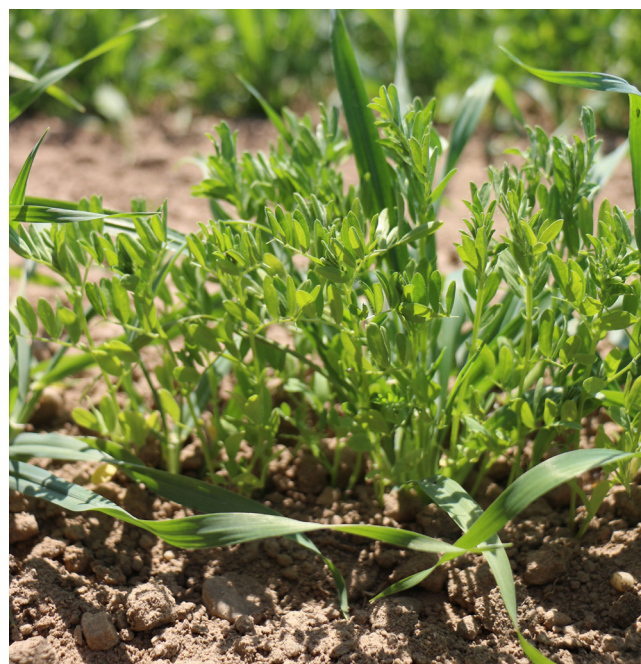
Linse kann am ehesten Trockenheit trotzen.