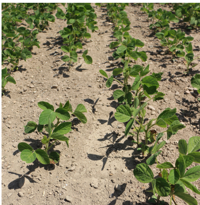
Soja ist wärmeliebend und weist ebenfalls einen hohen Wasserbedarf auf.

Bayerische Landesanstalt für Landwirtschaft. 2014. Kichererbse. Anbau und Verwertung. Freising-Weihenstephan. www.lfl.bayern.de/mam/cms07/publikationen/daten/informationen/059723_kichererbse.pdf#:~:text=Die%20Kichererbse%20ist%20eine%2C%20den%20mitteleurop%C3%A4ischen%20Standort%20und,s%C3%BCdlichen%20Breiten%20vielfach%20an%20die%20Stelle%20der%20Trockenspeiseerbse (Letzter Zugriff: 14.12.2021).