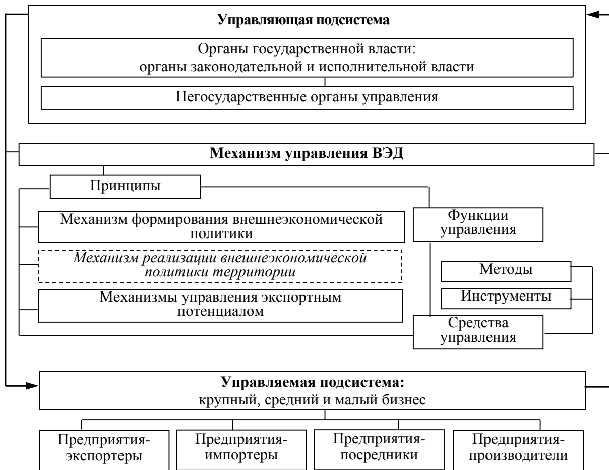
Рис. 2. Структура системы управления ВЭД

Субъектом управления в механизме формирования внешнеэкономической политики выступают органы законодательной власти. На примере системы управления ВЭД Донецкой Народной Республики таким субъектом является Народный Совет. Подготовка проектов законов по вопросам налогового и таможенного законодательства, государственной денежно-кредитной политики, ратификации международных договоров, государственного регулирования производства и оборота подакцизных товаров, особенностей развития малого и среднего предпринимательства в Донецкой Народной Республике входит в компетенцию Комитета Народного Совета по бюджету, финансам и экономической политике [12]. Для объективного рассмотрения законопроектов на заседания Комитета приглашаются представители Главы Донецкой Народной Республики, Правительства, Министерства финансов, Министерства доходов и сборов, Министерства экономического развития, Министерства агропромышленной политики и продовольствия, Центрального Республиканского Банка, Министерства промышленности и торговли, Государственного комитета по экологической политике и природным ресурсам, уполномоченные по защите прав предпринимателей, представители как научного, так и бизнес-сообщества, а также иных заинтересованных органов.