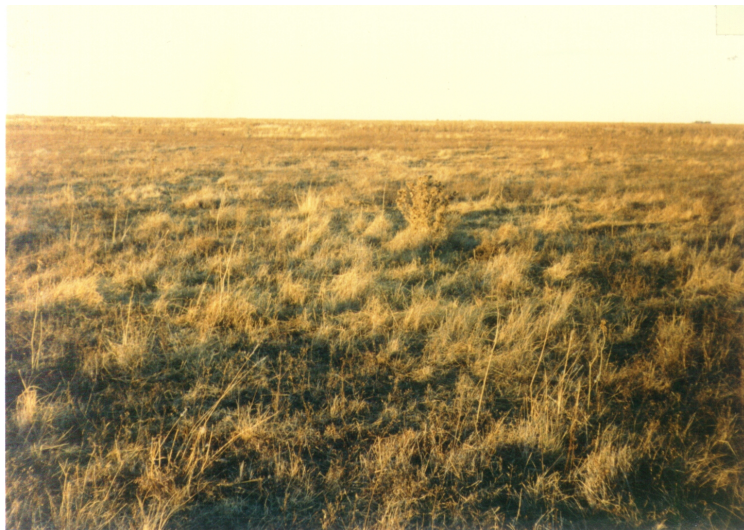
Figura 1: Fotos del perfil (izquierda) y del paisaje (derecha) de la Serie Estación Quilcó