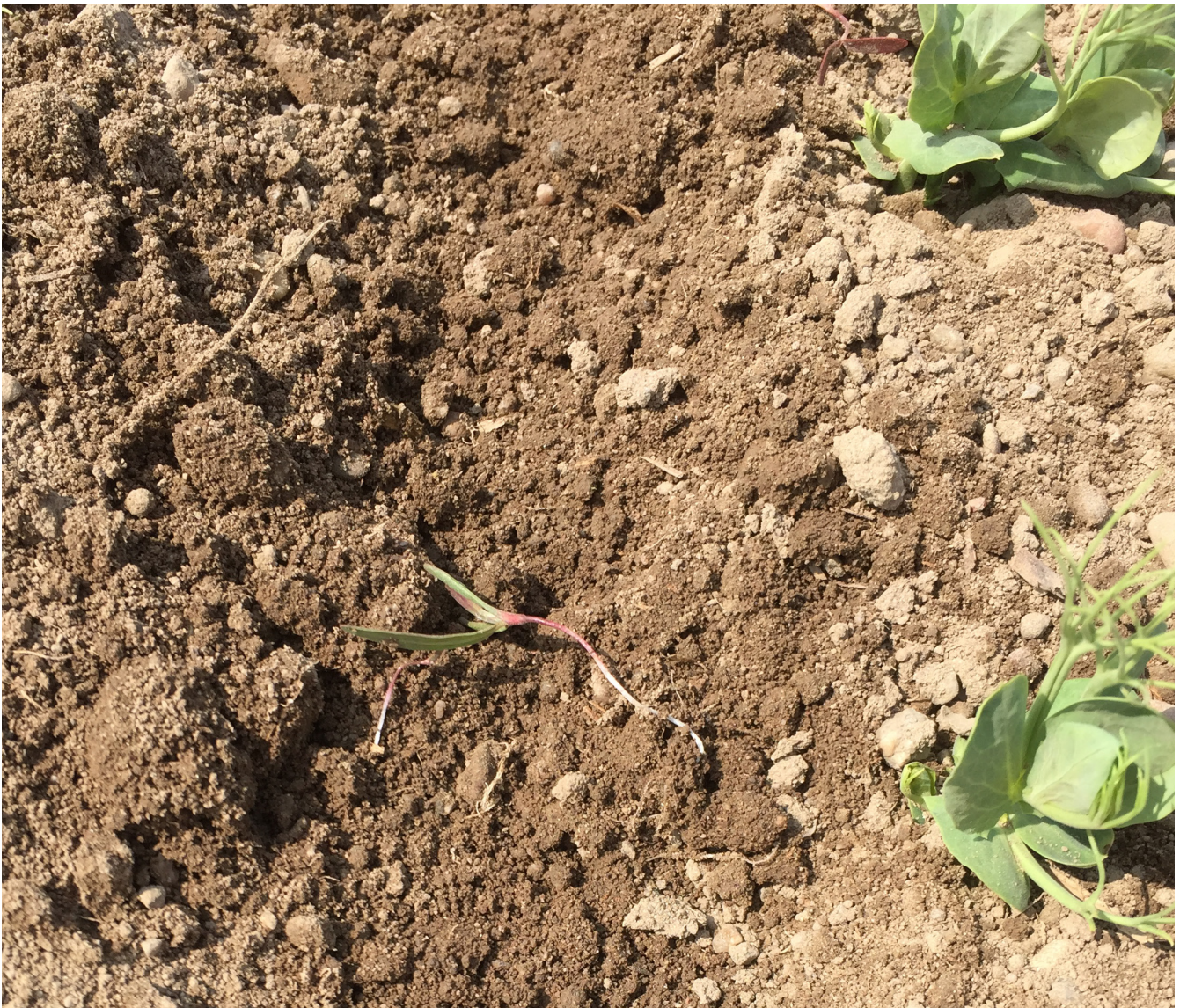
Optimaler Striegel- und Hackerfolg bei Unkräuter im Fädchen- und Keimblattstadium.

Generell kann mit dem Hacken so früh wie möglich begonnen werden. Im 2- bis 4-Blattstadium sollte ein Verschütten der Kulturpflanzen durch Schutzscheiben oder Winkelmesser verhindert werden. Allerdings sind Winkelmesser nur auf leichten Böden geeignet. Auf verschlammten, schweren Böden kommt das Winkelmesser nicht tief genug in den Boden. Nach Verranken der Erbsen ist auch der Hackeinsatz abgeschlossen. Abhängig von Unkrautdruck und Striegeleinsatz wird die Hacke ein- bis dreimal in Erbsen eingesetzt.