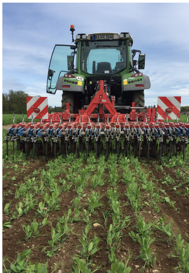
Striegeln im Erbsenbestand.

Bei geplanter mechanischer Unkrautregulierung ist es ratsam, die Aussaatmenge um 10 bis 15% zu erhöhen. Der höchste Wirkungsgrad mechanischer Unkrautbekämpfung kann bei leicht abgesetzten, schütffähigen und ebenen Böden erreicht werden. Vertiefungen wie Fahrspuren werden von den Arbeitsgeräten je nach Bautyp häufig nicht ausreichend erfasst und können verunkrauten. Abgetrocknete Böden und ein angepasster Reifeninnendruck sind wichtig, um Fahrspuren aber auch Strukturschäden möglichst zu vermeiden. Bei Frostgefahr sollte auf Bearbeitung verzichtet werden, da die Wurzeln der Kulturpflanze durch Striegeln und Hacken freigelegt