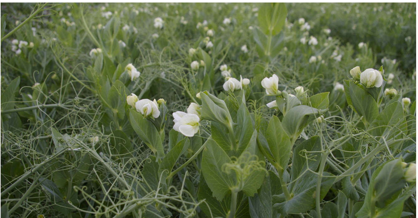
Blühende Erbsen in Sortenversuchen in Gülzow, Deutschland.

Bei zu hohem Unkrautdruck kann zusätzlich die Hacke eingesetzt werden. Hierfür sind im Vorfeld schon die Reihenabstände anzupassen. In der Regel werden Reihenabstände zwischen 25 und 50 cm gewählt, aber auch bei 15 cm Reihenabstand können mit entsprechender Steuerung (z. B. Kamera) gute Hackergebnisse erzielt werden. Essentiell ist, dass die Breite der Sämaschine mit der der Hacke übereinstimmt. Ansonsten besteht die Gefahr, dass stellenweise Reihen weggehackt werden.