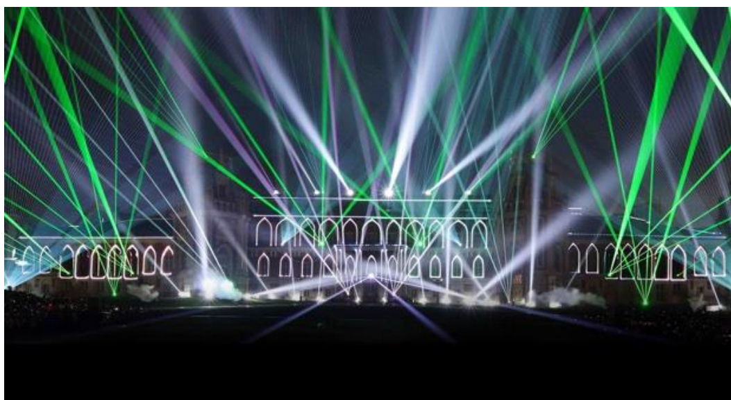
Рис. 4. Фестиваль «Вокруг света», лазерное шоу. Москва, 2014

Суперграфический подход находит свое продолжение в медиафасадах, лазерных шоу, анаморфозах, обоях для фасадов и пр. Такие формы способны зрительно кардинально менять не только архитектурные объемы, но и предметно-пространственную среду города в целом (рис. 4).