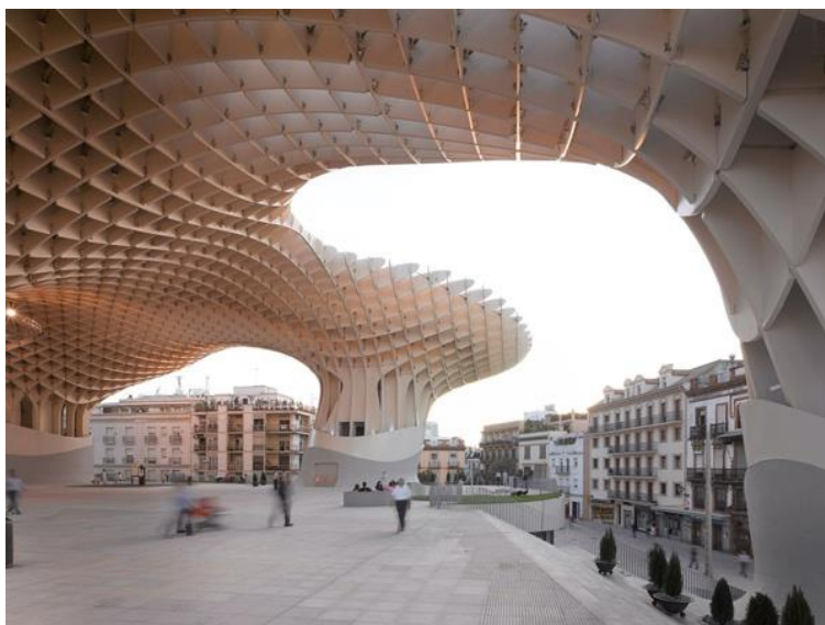
Рис. 6. Метрополь Parasol. Севилья, Испания, 2011

Всем этим требованиям и новым веяниям должен отвечать современный постиндустриальный дизайн, который в значительной степени расширил традиционные границы художественного синтеза в архитектуре и дизайне города, внося качественно новые предметные формы — арт-объекты, временные художественно-декоративные инсталляции, новые формы суперграфики и стрит-арта, ландшафтный дизайн и ландшафтная морфология в организации предметно-пространственной среды города. Исследование этих новых форм художественного синтеза, выявление его современных тенденций становятся одной из важнейших задач в области искусствоведения и теории дизайна городской среды.