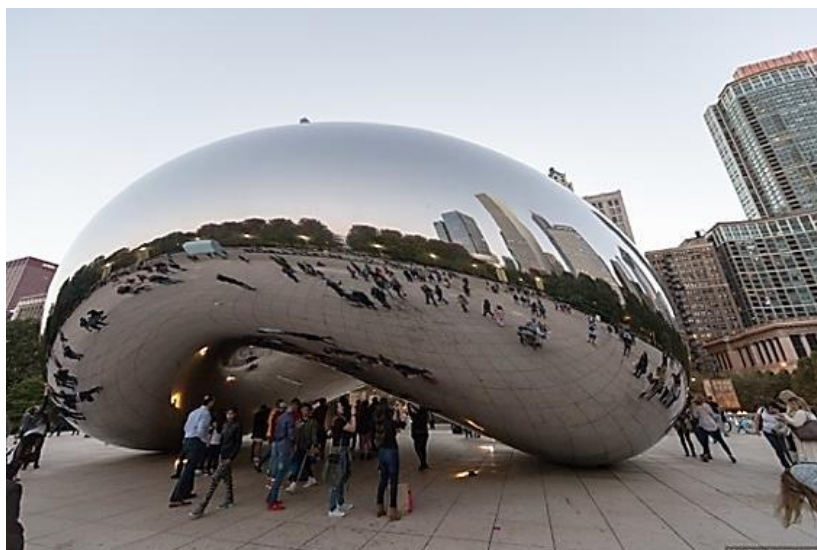
Рис. 1. Крупномасштабный арт-объект - скульптура «Облачные ворота» у входа в парк Миллениум. Чикаго (А.Капур), США, 2006

обозначения, введения нового понятия — «арт-объект». Под «арт-объектом» понимается форма, прежде всего предметная, в которой декоративная функция доминирует над утилитарной (последняя может вообще отсутствовать). При этом разнообразие видов арт-объектов существенно выходит за рамки традиционного типологического ряда художественно-декоративных форм — монумент, памятник, скульптурная композиция, малая архитектурная форма и др. Используемые, при создании таких объектов городской среды, материалы и технологии также носят, как правило, нетрадиционный, инновационный характер. Все это находит свое отражение в философии формообразования создаваемого арт-объекта, его художественно-стилистическом решении. Создаваемые на основе новейших материалов и технологий такие художественно-декоративные объекты решались зачастую в стилях «функционализм», «хай-тек», «параметризм», либо, напротив, создавались на основе использования т.н. «вторичного сырья», старых предметов с приданием им новой функциональной направленности (стилевое течение «краж энд редди»). Отличительными чертами арт-объектов являются: непредсказуемость, уникальность, нетрадиционность, провокационность, спонтанность и импульсивность [8]. Формообразование таких революционных объектов часто не подчиняется никаким традициям и правилам (рис. 1).