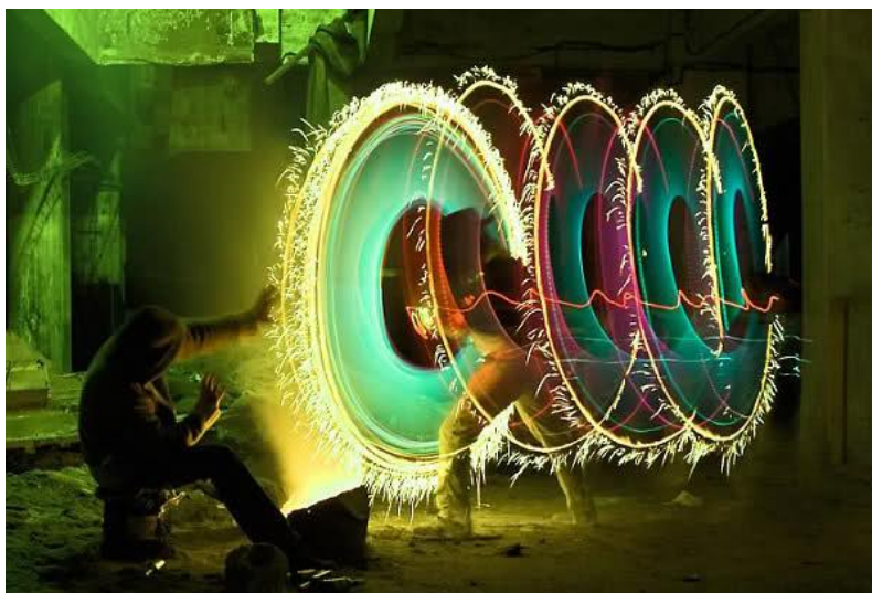
Рис. 3. Световое граффити. Снимок Я.Веллerta и Д.Мидза. Бремен, Германия, 2011

В процессе своего развития традиционная архитектурная суперграфика, ориентированная на новые технологии, превратилась из средства активного цветографического преобразования на визуальном уровне отдельных архитектурных объемов и объектов предметно-пространственной среды в проектно-художественный метод, который несет с собой новые формы художественного синтеза в дизайне города [7].