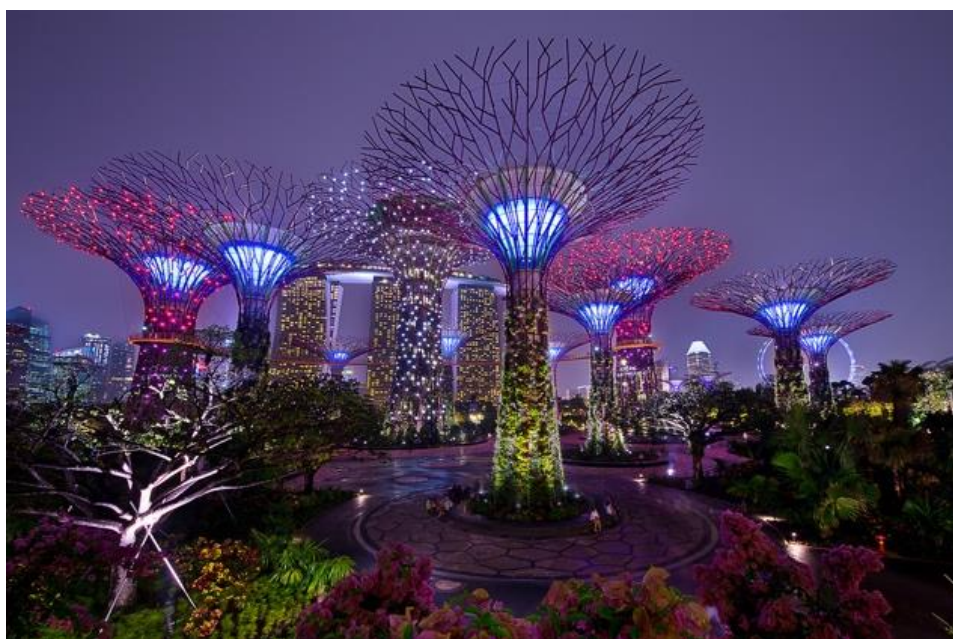
Рис. 5. Cloud Park в Сингапуре, 2012

В условиях техногенной среды современного города особую актуальность приобретают вопросы экологии и восполнения средствами дизайна дефицита природной составляющей. На решение этих вопросов направлен «ландшафтный дизайн». Его цель — своего рода «возвращение к живой природе» - создание психологически и физиологически комфортной для человека среды с элементами природных и природоподобных объектов (формы-ассоциации и формы-имитации) [3]. Это нашло выражение в развитии таких художественно-стилевых течений, как органическая архитектура, зоо- и биоморфизм, параметризм и пр. (рис. 5)