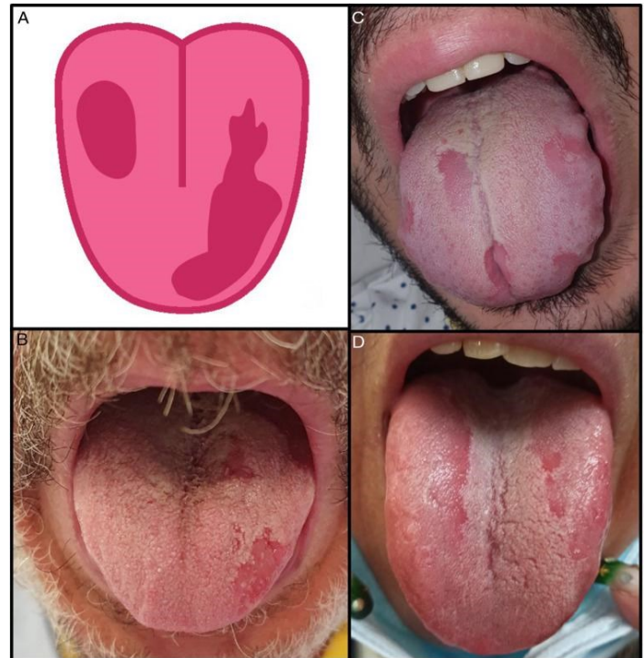
Figura 2. Lengua "COVID-19"

Como humanidad nos encontramos con el desafío de elaborar un tratamiento efectivo para controlar y curar la infección por COVID-19.