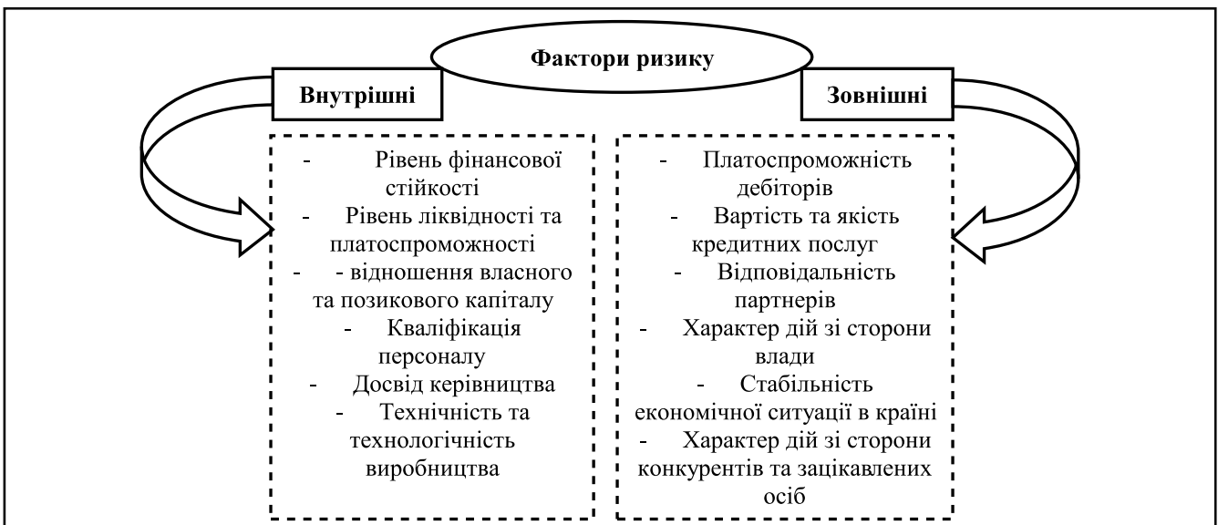
Рисунок 4. Фактори ризику фінансово-економічної безпеці бізнесу під впливом Covid-19