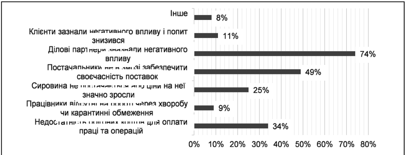
Рисунок 3. Основні проблеми діяльності у сфері бізнесу при пандемії у 2020 році