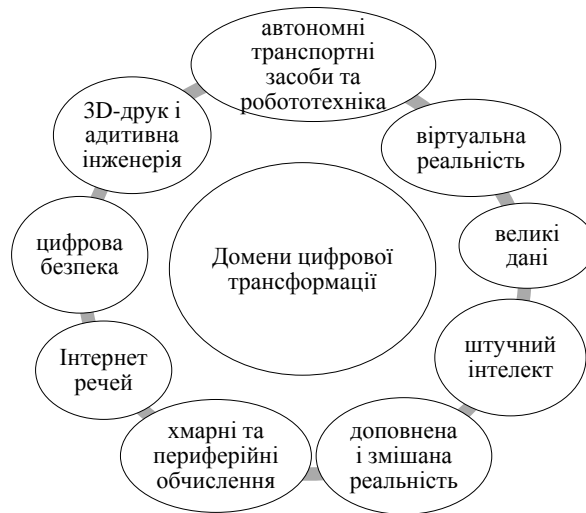
Рисунок 2. Основні цифрові домени цифровізації

Поширення цифровізації на морському транспорті найбільш виражено в навігаційних системах, наприклад, концепції електронної навігації та поточних розробках у навігації загалом [5].