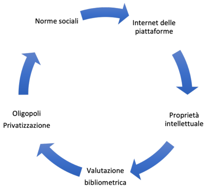
Fig. 1: Il circolo vizioso di privatizzazione dei dati della ricerca

Il resto di questo scritto è organizzato nel modo seguente. Nel paragrafo 2 si mette in evidenza la contraddizione delle politiche europee: da un lato, promozione della scienza aperta, dall'altro, rafforzamento della proprietà intellettuale. Nel paragrafo 3 si descrivono le dinamiche di privatizzazione dei dati aperti basate sul controllo esclusivo di dati e algoritmi. Nel paragrafo 4 si passano in rassegna alcune proposte di cambiamento nella politica delle infrastrutture di ricerca col fine di restituire a settore pubblico, università, enti e istituti di ricerca il controllo dei dati. Nel paragrafo 5 si traggono alcune conclusioni anche in relazione al panorama italiano.