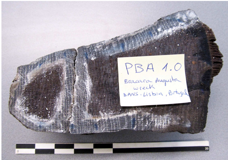
Afbeelding 1. Monster 1052 (meetreeks PBA00010).