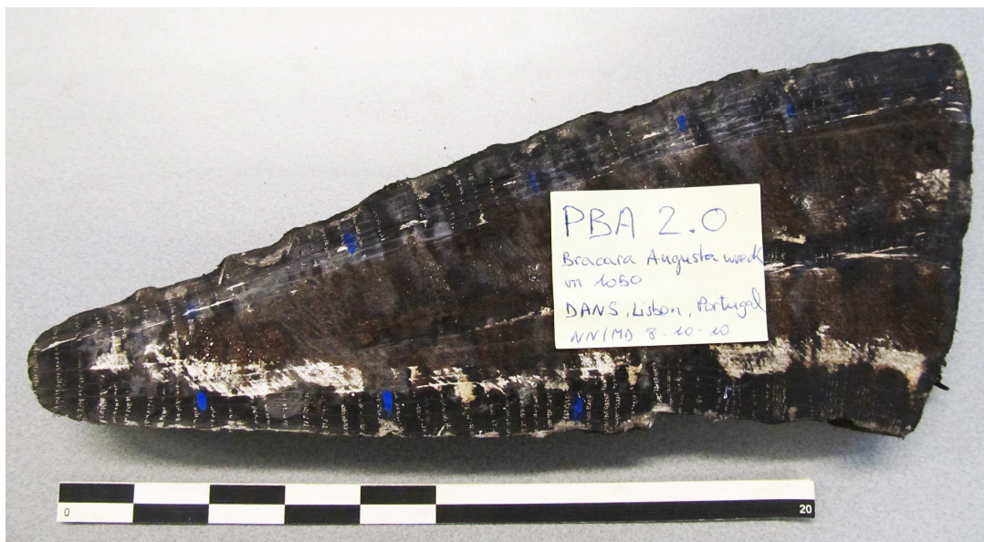
Afbeelding 2. Monster 1050 (meetreeks PBA00020).