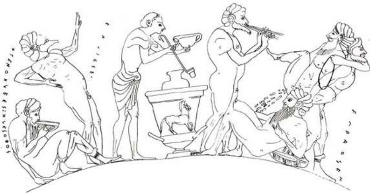
Fig. 6b – Dessin Tsingarida 2009, 107, fig. 3, mise au net par N. Bloch – CreA