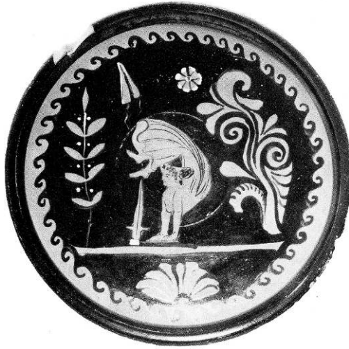
Fig. 9 – Plat apulien à figures rouges attribué au Groupe de l'Alabastre, vers 330-325. Washington DC, Collection John Gomperts & Katherine Klein, d'après RVAp II, 21 / 46, pl. 234.1

Un plat apulien ( fig. 9 ) met en scène une acrobate vêtue d'une longue jupe aux plis gonflés, effectuant la culbute canonique appuyée sur les mains, tandis que l'un de ses pieds vient effleurer la pointe de l'épée plantée sur une ligne de sol 162 . Une bandelette est suspendue dans le champ, rempli par ailleurs de rameaux de végétaux stylisés. La dynamique interne proposée par le peintre semble jouer sur la circularité du plat et de son médaillon, à laquelle répond la posture courbe de la figure centrale. La forme particulière du vase, animée au centre d'un léger ressaut correspondant au départ du pied, accroche la lumière d'une manière particulière. Le vase, dont il faut imaginer la manipulation – qui selon l'angle de réflexion de la lumière fait briller le vernis –, semble intégrer le corps de la figure à partir des avant-bras au sein d'un cadre circonscrit, qui par un jeu d'équivalence pourrait évoquer le cerceau.