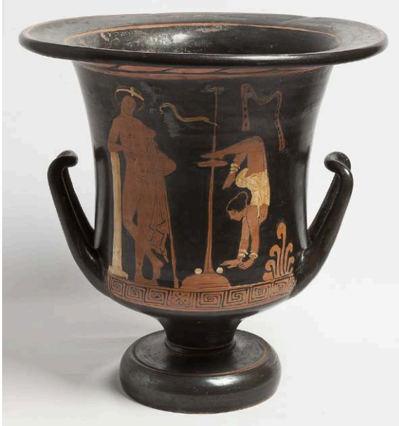
Fig. 8 – Cratère en calice apulien à figures rouges attribué au Peintre de Rohan, vers 380-370 av. J.-C., provenant de Fasano. Gênes, collection Odon de Savoie, Museo di Archeologia Ligure (inv. 1142). Concession de la Surintendance

presque toucher le disque médian du kottabos de son pied gauche renversé. À la base du kottabos agrémenté d'une bandelette se trouvent deux sphères posées au sol. Cet assemblage est observé par un jeune homme couronné, tenant un bâton de son bras gauche enroulé dans un himation et appuyé du coude droit sur un pilier évoquant la palestre. S'agit-il ici, par un savant jeu de correspondances, d'évoquer par métonymie le spectacle des sens, distraction du citoyen, en déclinant de manière synthétique l'équilibre, presque chorégraphié, en jeu dans ces pratiques ? La syntaxe de l'image semble reposer sur un double système d'association – souplesse et habileté nécessaires au mouvement contrarié de l'acrobate et à la gestualité caractéristique du kottabos – et d'opposition, entre le citoyen et l'amuseur à la marge de la société civique.