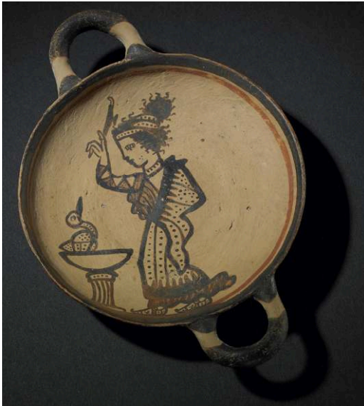
Fig. 1 – Joueuse de Kottabos visant un canard flottant dans un loutērion. Kylix corinthienne à figures noires, attribuée au Sam Wide Group, découverte à Tanagra, vers 450-400 av. J.-C. Londres, British Museum, n° E 813 (inv. 1873,0915.9), n° photo 883938001