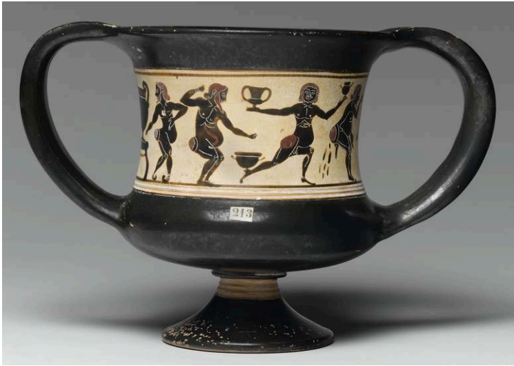
Fig. 10 – Canthare laconien à figures noires, attribué à l'atelier du Peintre de la Chasse, vers 550-540 av. J.-C. Paris, Musée du Louvre, n° MNE1324

à cet équilibriste est en effet proposé à sa droite ; incapable de se tenir, ce cômaste en position semi-accroupie, les parties génitales surdimensionnées et coincées entre ses cuisses 169 , défèque en direction de son collègue un peu trop fier. Une fois n'est pas coutume, le cratère à gauche de la scène en constitue la clef de lecture ; il est la source du vin. Les attitudes différentes des cômastes ne sont que des variations au sein de la gamme des états d'ébriété qui guettent le buveur 170 .