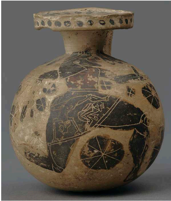
Fig. 7 – Personnage courant avec des acrobates incisés sur son chiton . Aryballe globulaire corinthien à figures noires, Corinthien ancien à moyen (620-570). Oxford Ashmolean Museum, n° AN1928.315

Un cratère à colonnettes corinthien à figures noires de la fin du VII e siècle présente une association similaire 138 . Au niveau de l'épaule, au milieu d'une frise de cinq padded dancers , deux des cômastes sont penchés en avant, un bras appuyé sur le sol ; de leurs postérieurs, appuyés l'un contre l'autre, deux traînées croisées de points vernis semblent indiquer une défécation 139 . Leurs yeux sont tournés vers le haut, en direction d'un cinquième personnage qui, à l'horizontale, saute par-dessus le binôme d'une pirouette acrobatique.