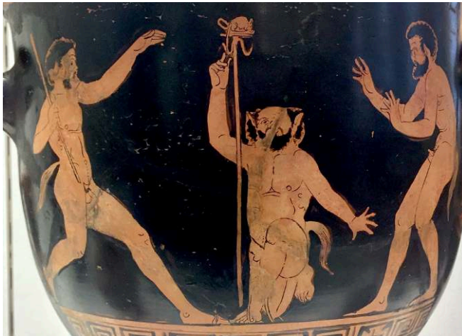
Fig. 4 – Satyres jouant avec une souris, cratère en cloche lucanien attribué au Peintre de Brooklyn-Budapest, Moscou, Musée Pouchkine, II. 1B 734, vers 380-370 av. J.-C