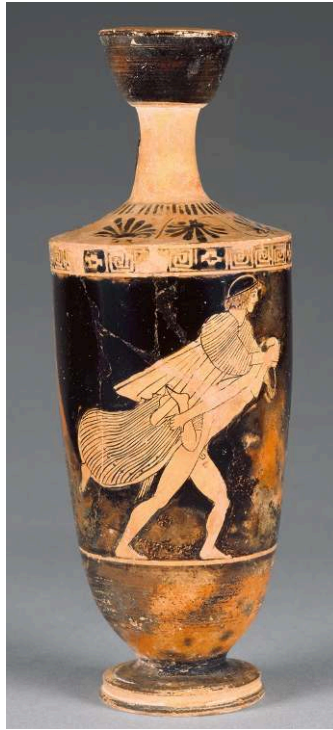
Fig. 5 – Lécythe attique à figures rouges, attribué à l'atelier du Peintre de Carlsruhe, vers 470-460 av. J.-C. Malibu, Getty Museum, n° 71.AE.444.

Cet exemple se distinguerait néanmoins au sein de la série des scènes d' ephedrismos par sa technique à figures noires, son cadre, son mobilier, sa dimension collective, ainsi que par les attitudes et représentations corporelles de ses figures, qui renvoient clairement à l'iconographie du symposion et du kômos attiques 123 . À droite de la scène, un convive est couché par terre, son bras gauche appuyé sur un coussin, à la manière donc d'un participant au symposion . Au-dessus de lui, un groupe de deux cômastes est engagé dans une possible scène d' ephedrismos pour le moins inhabituelle. Le porteur accueille, dans la boucle formée par ses mains jointes dans le dos, le genou de son compagnon, qui lui enserme le cou. Si la gestuelle est caractéristique du jeu, elle est néanmoins détournée. Le cavalier tient en effet une couronne de banqueteur de la main gauche, le genou accueilli n'est ensuite pas le bon, et pour