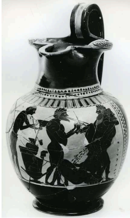
Fig. 6a – Cenochoé attique à figures noires, attribuée à Kleisophos, vers 575-525 av. J.-C. Athènes, Musée Archéologique National, n° 1045