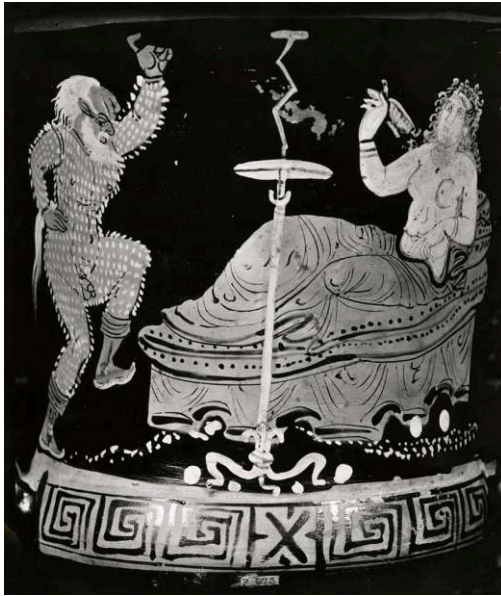
Fig. 3 – Femme joueuse de kottabos et satyre dansant. Cratère en calice apulien à figures rouges, attribué au Schlaepfer Painter, provenant de Capoue, vers 360-350 av. J.-C. Londres, British Museum (inv. 1873,0820.345)