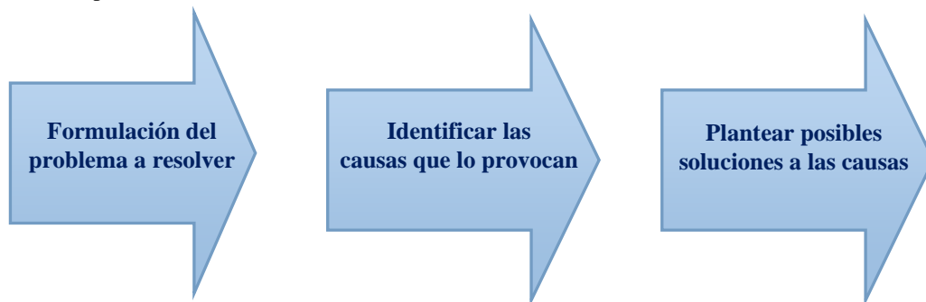
Figura 2: Procedimiento para la resolución de problema de toma de decisiones.

Cada problema de toma de decisiones puede ser diferente, sin embargo a partir de la versatilidad de su naturaleza se puede definir un procedimiento para la resolución de problemas. La Figura 2 muestra un esquema para la resolución de problemas de toma de decisiones.