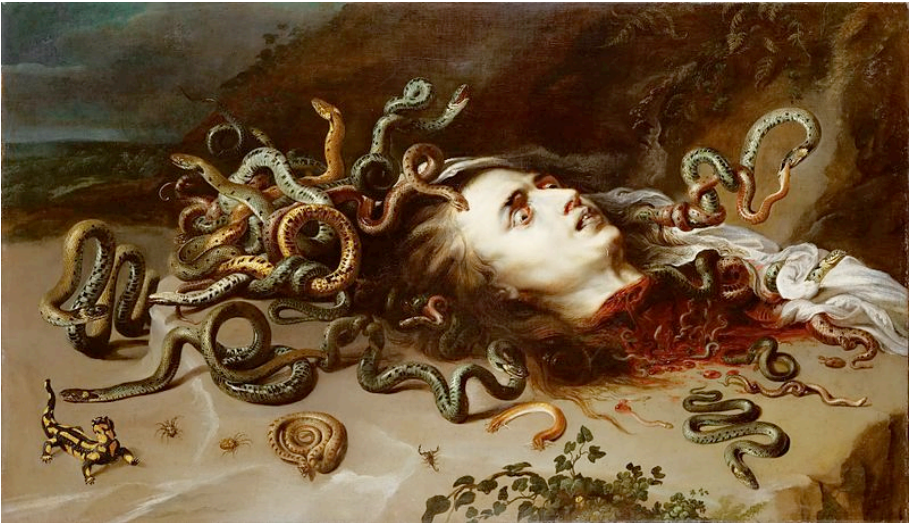
Haupt der Medusa von Peter Paul Rubens, circa 1617/18.

Ich beantrage die Verhaftung und strafrechtliche Verurteilung aller Teilnehmer und Organisatoren des 22. EPA-Kongresses {1} wegen gemeinschaftliches und bandenmäßiges Betrugs zwecks eigennütziger Bereicherung; wegen Durchführung pseudomedizinischer Experimente an Menschen, um chemische Kampfstoffe auszutesten; wegen Rechtfertigung der Hexenverfolgung. Im Einzelnen handelt es sich um die Straftatbestände Betrug, Fälschung akademischer Graden, Kurpfuscherei, Mord, gefährliche Körperverletzung, Nötigung, Freiheitsberaubung, Entführung, Bildung krimineller und terroristischer Vereinigung. Die Begründung genannter Maßnahmen erfolgte früher {2-4}, und wird im Folgenden erweitert und ergänzt.