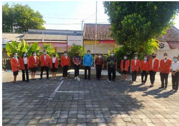
Gambar 4. Foto Kegiatan Program Pendampingan