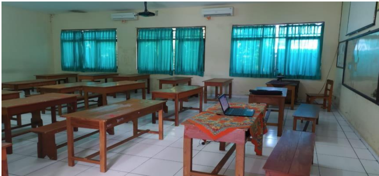
Gambar 2. Ruang Kelas

Setelah dikenalkan dengan pembelajaran daring dalam bentuk aplikasi zoom dan Google Classroom , pemikiran untuk menjadikan aplikasi ini sebagai sumber belajar mulai terbuka. Umpan balik yang mereka berikan seperti, minta pendampingan dalam pengelolaan kelas, paparan yang diberikan menambahkan wawasan tentang pola pembelajaran abad 21, dan permintaan untuk meng-kombinasikan dengan media lainnya. Umpan balik tersebut menandakan keterbukaan pikiran guru untuk menggunakan aplikasi tersebut sebagai bagian dari pembelajaran di kelas. Pelatihan dalam bentuk pemberian materi guru. Hal tersebut dikuatkan dari hasil angket umpan balik keterlaksanaan pengabdian. Poin yang dievaluasi mencakup; (1) Kualitas materi yang disampaikan (2) ketersediaan fasilitas pendukung yang ada, dan (3) kejelasan modul pendukung kegiatan pelatihan.