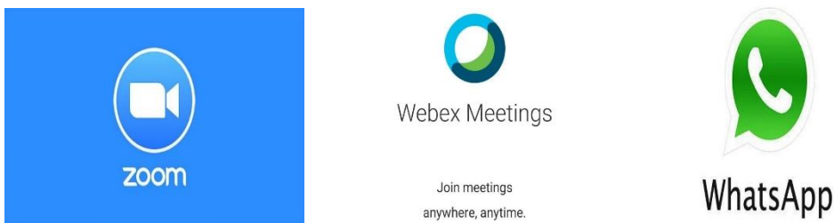
Gambar 3. Teknologi Pembelajaran

Setelah dikenalkan dengan pembelajaran daring dalam bentuk aplikasi zoom dan Google Classroom , pemikiran untuk menjadikan aplikasi ini sebagai sumber belajar mulai terbuka. Umpan balik yang mereka berikan seperti, minta pendampingan dalam pengelolaan kelas, paparan yang diberikan menambahkan wawasan tentang pola pembelajaran abad 21, dan permintaan untuk meng-kombinasikan dengan media lainnya. Umpan balik tersebut menandakan keterbukaan pikiran guru untuk menggunakan aplikasi tersebut sebagai bagian dari pembelajaran di kelas. Pelatihan dalam bentuk pemberian materi guru. Hal tersebut dikuatkan dari hasil angket umpan balik keterlaksanaan pengabdian. Poin yang dievaluasi mencakup; (1) Kualitas materi yang disampaikan (2) ketersediaan fasilitas pendukung yang ada, dan (3) kejelasan modul pendukung kegiatan pelatihan.