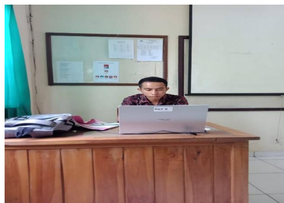
Gambar 5. Foto Kegiatan Program Pendampingan