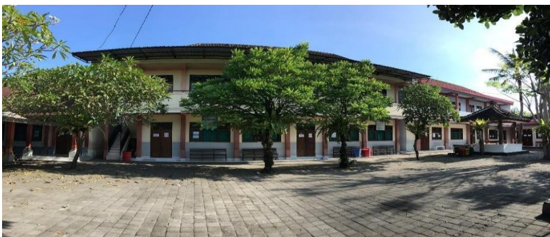
Gambar 1. Kondisi Bangunan

Pandemi global membawa pada kebiasaan hidup baru, belajar di rumah, bekerja di rumah dan beribadah di rumah. Sistem pembelajaran daring ini masih menjadi kesulitan bagi guru dan siswa. Sistem pendidikan yang dilakukan sejauh ini adalah Pembelajaran Jarak Jauh secara daring.