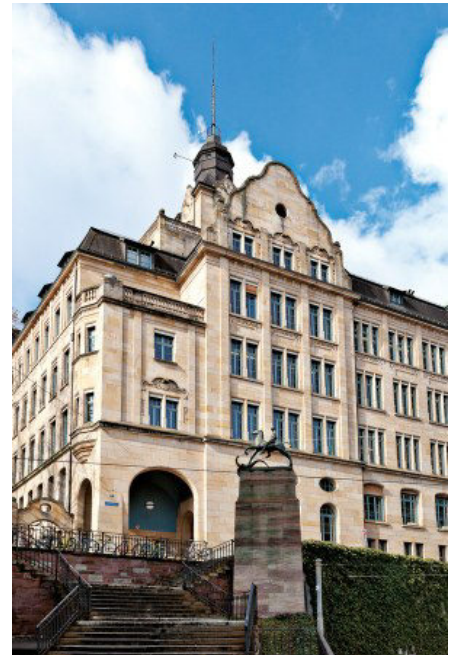
Abb. 7: Gymnasium Leonhard

Wie bei Christoffel (1913) nachzulesen ist, hat die Töchterschule ihre Ursprünge im Jahr 1812, als auf private Initiative eine Stadttöchterschule gegründet wurde. 1814 wurde sie auf Beschluss des Kleinen Rates als obrigkeitliche Schule fortgeführt. Die Töchterschule wuchs kontinuierlich. Hatte sie in den Anfängen etwa 60 Schülerinnen, so besuchten 1855 336 Mädchen den Unterricht. Mit dem Schulgesetz von 1852 wurde im Kanton Basel Stadt eine Mädchenge-meinschafteschule mit 6 Klassen eingeführt, an deren vierte Klasse die Töchterschule nun anschloss. Das Schulgesetz von 1880 ermöglichte die Errichtung von Fortbildungsklassen, die der Erweiterung der allgemeinen Bildung, aber auch der Ausbildung von angehenden Lehrerinnen dienten. 1881 bestanden die ersten beiden Lehrerinnen die Schlussprüfung. Die Zunahme der Bevölkerung gegen Ende des 19. Jahrhunderts in der Stadt hatte auch Einfluss auf die Schülerinnenzahl. Bei der Einweihung des neuen Gebäudes an der Kanonengasse 1884 zählte man 520 Schülerinnen. 1892 musste ein zusätzliches Haus an der Leonhardstrasse bezogen werden.