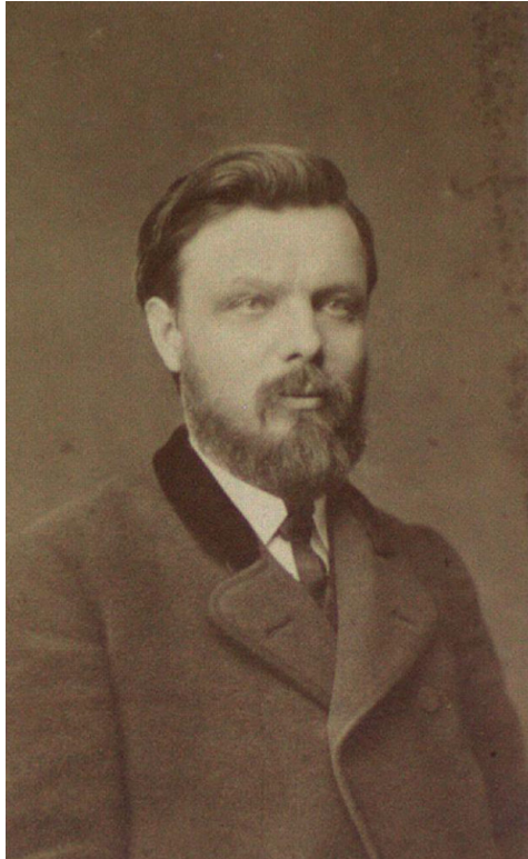
Abb. 4: Largiadèr in Rorschach

de. 1864 wurde das Seminar eigenständig und erhielt in Mariaberg Rorschach einen neuen Standort. Es war nun direkt dem neugeschaffenen Erziehungsrat unterstellt.