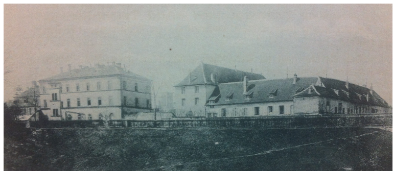
Abb. 5: Seminar in Pfalzburg

Das Lehrerseminar in Pfalzburg wurde am 11. Mai 1876 eröffnet (Kahl, 1901). Es war in einem ehemaligen Kapuzinerkloster untergebracht, in dem sich seit 1804 ein Collège befand. Es hatte Platz für 55 Schüler, die in den Anfängen vom Direktor und zwei Lehrern unterrichtet wurden. Die Ausbildung dauerte 3 Jahre ohne das Vorbereitungsjahr im Präparandenkurs. 1879 schlossen die ersten 28 Seminaristen die Ausbildung erfolgreich ab. Schon bald nach der Eröffnung der Anstalt stellte sich heraus, dass die Zahl der