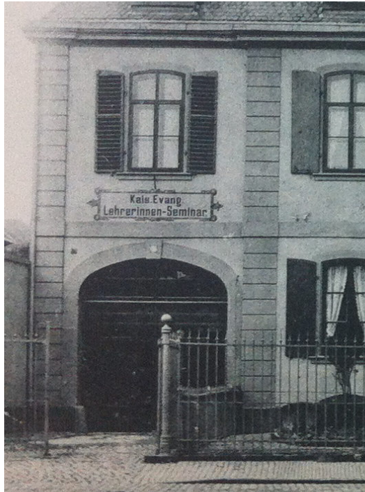
Abb. 6: Kais. Evang. Lehrerinnen-Seminar

Die Ausbildung dauerte drei Jahre. Rund 60 Schülerinnen, 50 davon intern untergebracht, verteilten sich auf 3 Seminarklassen. Unterrichtet wurden sie vom Direktor und 7 Lehrerinnen und Lehrern. Largiadèr erteilte Lektionen in Religion, deutscher Sprache, Literatur und Naturlehre an der obersten Klasse sowie Pädagogik in allen drei Klassen (Walkmeister, 1903). Dem Seminar angeschlossen war eine Übungsschule, die ebenfalls aus drei Klassen bestand (Zänker, 1896).