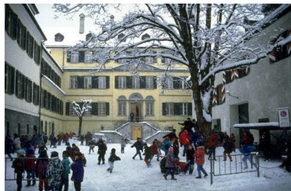
Abb. 3: Schulhaus St. Nikolai

Die Lehrerausbildung entwickelte sich im Kanton Graubünden in der ersten Hälfte des 19. Jahrhunderts und war in ihren Anfängen konfessionell aufgeteilt. Für die reformierten angehenden Dorfschullehrer richtete die evangelische Kantonsschule von Graubünden in Chur 1821 eine drei Jahre dauernde Ausbildung ein. Ab 1837 bot auch die private Lehranstalt in Schiers eine freiwillige Schullehrerausbildung an. Für die katholische Seite wurde 1832 in der katholischen Kantonsschule in Disentis eine entsprechende Abteilung gegründet. 1850 schlossen sich die Kantonsschulen zur vereinigten Kantonsschule in Chur zusammen. 1852 wurde deren Seminarabteilung teilweise verselbständigt. Sie erhielt eigene Räumlichkeiten mit einem Konvikt im zur Kantonsschule gehörenden Gebäude des ehemaligen Klosters St. Nikolai und einen leitenden Seminardirektor (vergl. Michel, 1954 und Bundi, 2004). Largiadèr, der während seiner Tätigkeit in Tschierv zur Ansicht gelangte, er müsse mehr lernen, um ein Lehrer zu sein, trat im Herbst 1852 in die unterste Klasse des Seminars ein. Bald konnte er auf Grund seines Alters und seiner Reife eine Klasse überspringen. 2 Jahre später schloss er das Seminar mit einem „Patent erster Klasse mit Auszeichnung“ ab. Welchen Eindruck Largiadèr auf seine jüngeren Mitschüler machte, beschrieb ein Freund viele Jahre später: