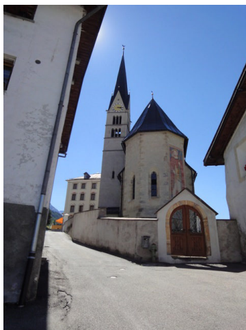
Abb. 1: Alte Strasse und Kirche