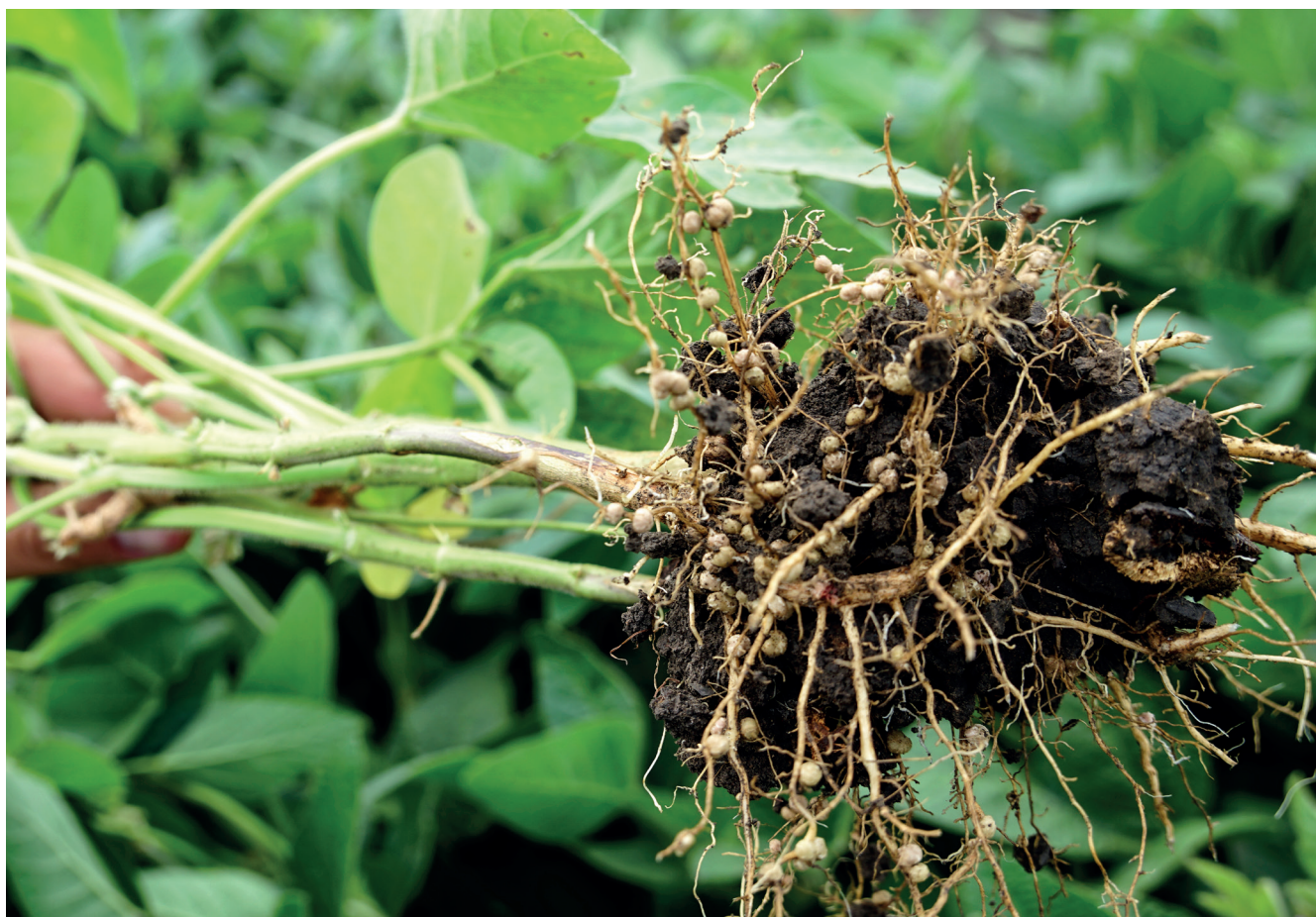
Фотография 3. Корневые клубеньки сои в поле.

Установление симбиоза между азотфиксирующими бактериями и бобовым растением-хозяином является ключевой задачей для каждого фермера, выращивающего бобовые культуры. В дополнение к естественному пути, значительное количество БФА может быть получено путем инокуляции семян соответствующим штаммом азотфиксирующих бактерий. Инокуляция необходима для сои, поскольку европейские почвы не содержат необходимых видов. Напротив, европейские почвы содержат штаммы, инфицирующие горох, конские бобы, фасоль обыкновенную и клевер, поэтому реакция на инокуляцию очень разнообразна. В некоторых ситуациях, естественные местные штаммы азотфиксирующих бактерий в почве отсутствуют или обладают низкой азотфиксирующей активностью. Для этого необходимо внести в почву отобранные штаммы азотфиксирующих бактерий, отличающихся высокой азотфиксирующей активностью. Как это делается для сои, подробно описано в Практической заметке 1 Legumes Translated.