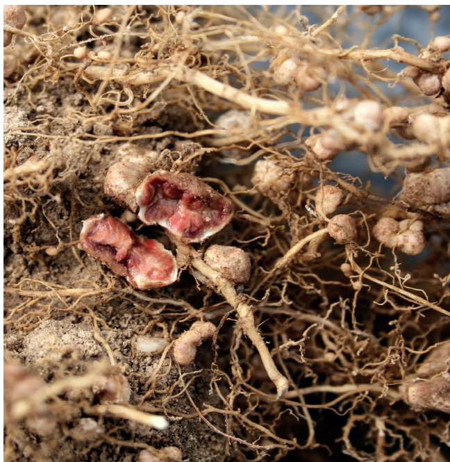
Фотография 1. Фотография крупным планом разделенного узелка с характерным розовым цветом. Это свидетельствует об успешном закреплении ризобия и активной биологической азотной фиксации.

Бобовые являются наиболее важными хозяевами БФА в наземных экосистемах, особенно в сельскохозяйственных экосистемах. Азот, фиксированный бобовыми культурами, является альтернативой синтетически фиксированному азоту в удобрениях. Благодаря БФА, введение бобовых в системы земледелия снижает некоторые вредные выбросы от сельскохозяйственного азотного цикла, особенно закиси азота ( N_2O ), который является мощным парниковым газом.