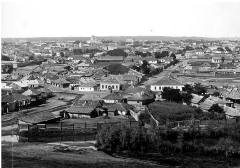
Panorama orașului la 1889, centrul istoric din Chișinău