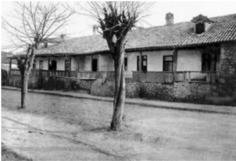
Casă din ograda Armenească [19].

de locuințe, din care sunt construite încăperile menite activităților comerciale: prăvăliile și beciurile pentru mărfuri.