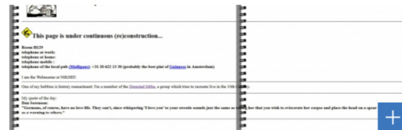
De pagina van Kees Huysen Download originele afbeelding

Op 12 maart 2019 bestond het wereldwijde web precies dertig jaar. Nadat de leidinggevende zijn fiat had gegeven aan het voorstel van Tim Berners-Lee met de woorden “vague, but exciting”, kon de bedenker en grondlegger van het web aan de slag. Op 6 augustus 1991 kwam de eerste website online bij CERN in Zwitserland. De tweede website kwam op het web bij het SLAC National Accelerator Laboratory in de VS.