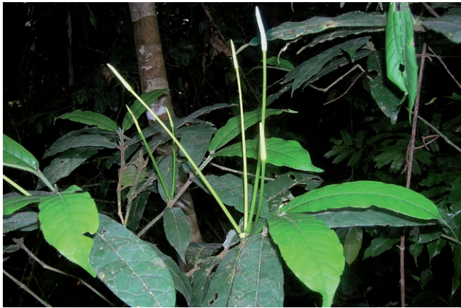
Fig. 2. – Oxyanthus andjigae Sonké & O. Lachenaud. Plante avec fleurs en boutons. [Luke & Rogers 15205]

et dents triangulaires de 0,2-1 mm, glabres à courtement pubérulentes. Corolle glabre, à tube vert pâle cylindrique et très étroit de 18-19,5 × 0,2-0,3 cm, et lobes blanc crème étroitement lancéolés, aigus au sommet, de 2,2-3,8 × 0,2-0,4 cm. Anthères presque entièrement exsertes, insérées à la gorge de la corolle, glabres, linéaires, 8-8,5 × 0,7 mm, à sommet apiculé sur +/- 1 mm. Style exsert sur +/- 2,5 mm, glabre, à stigmate allongé légèrement renflé. Fruits jaunes, ellipsoïdes à subglobuleux, arrondis aux deux bouts, 2,5-3 × 2-3 cm, lisses et glabres, à pédicelle court (+/- 4 mm) et calice caduc; nombreuses graines irrégulièrement ellipsoïdes, comprimées, +/- 6,5 × 3,5 mm, à surface ornée de stries longitudinales saillantes sur toute sa longueur.