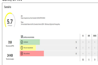
Fig. 1 - Análise do AccessMonitor na homepage da BDM/UFRN