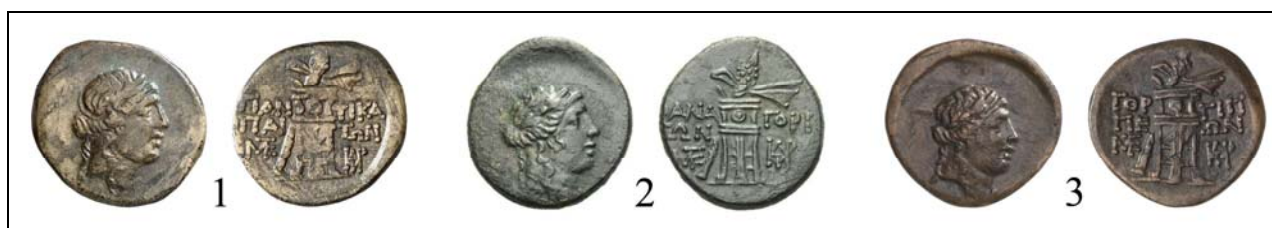
Рис. 6. Тетрахалки городов Боспора с монограммами \text{KP} и \text{ME} на реверсе (по bosporan-kingdom.com: 54; bosporan-kingdom.com: 55; bosporan-kingdom.com: 56).