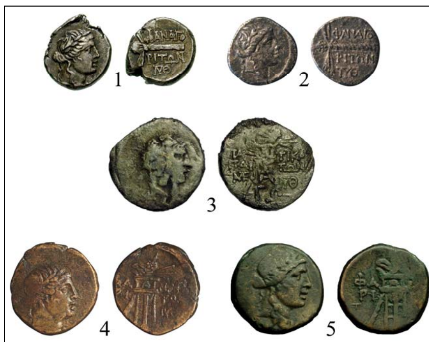
Рис. 8. Серебряные, медные и бронзовые монеты Фанагории с монограммами \text{TYO} , \text{MF} и «Т» на оборотной стороне.