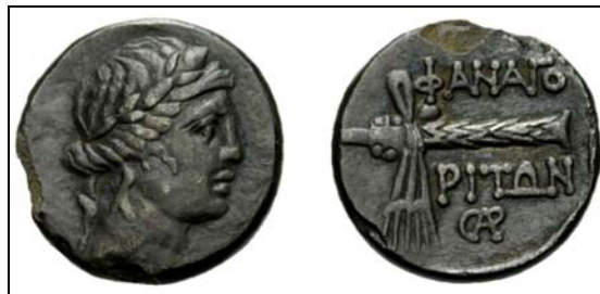
Рис. 9. Драхма Фанагории с монограммой Α на реверсе (по bosporan-kingdom.com: 62).

Fig. 9. The drachma of Phanagoria with monogram Α on the reverse (after bosporan-kingdom.com: 62).