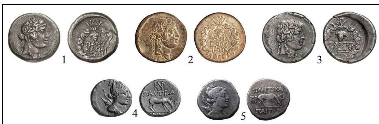
Рис. 4. Драхмы и гемидрахмы городов Боспора, выпущенные в первый период наместничества Митридата Младшего (по bosporan-kingdom.com: 28; bosporan-kingdom.com: 29; bosporan-kingdom.com: 30; bosporan-kingdom.com: 44; bosporan-kingdom.com: 45).