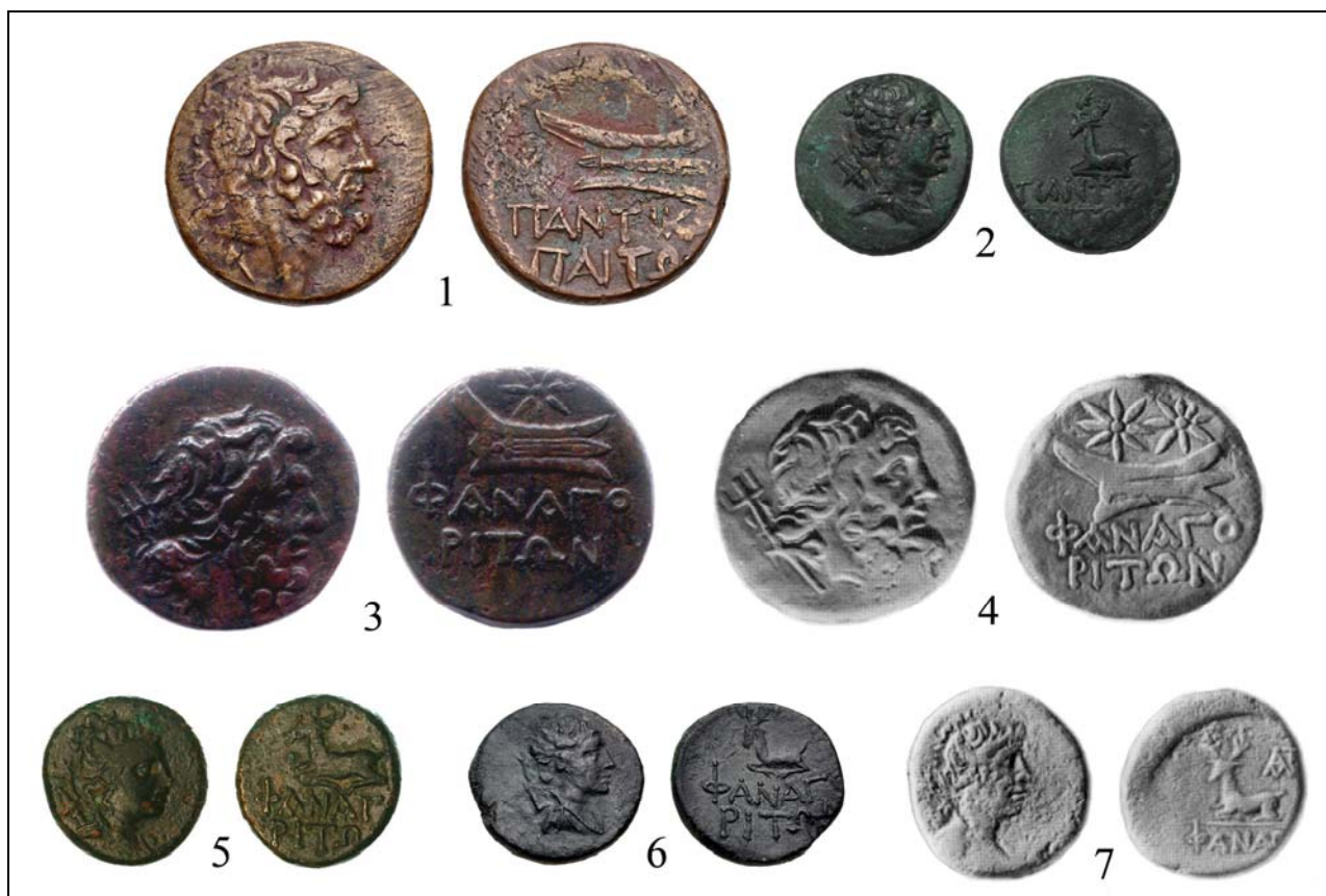
Рис. 3. Первая серия боспорских медных и бронзовых монет понтийского периода (по Анохин 2011: № 1172, 1174; bosporan-kingdom.com: 39; bosporan-kingdom.com: 40; bosporan-kingdom.com: 41; bosporan-kingdom.com: 42; bosporan-kingdom.com: 43).