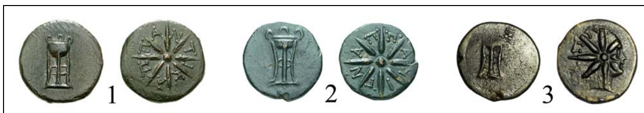
Рис. 1. Бронзы Пантикапея с треножником на лицевой стороне и со звездой на оборотной (по bosporan-kingdom.com: 31; bosporan-kingdom.com: 32; bosporan-kingdom.com: 33).

Fig. 1. Bronze of Panticapaeum with tripod on the obverse and with a star on the reverse (after bosporan-kingdom.com: 31; bosporan-kingdom.com: 32; bosporan-kingdom.com: 33).