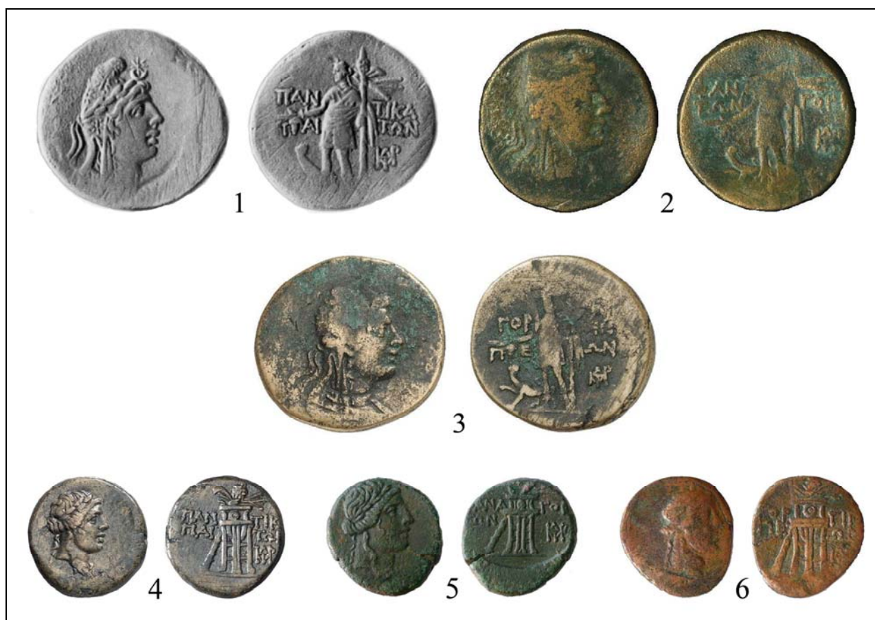
Рис. 5. Медные и бронзовые боспорские монеты, выпущенные в первый период наместничества Митридата Младшего (по Анохин 2011: № 1119; bosporan-kingdom.com: 48; bosporan-kingdom.com: 49; bosporan-kingdom.com: 50; bosporan-kingdom.com: 51; bosporan-kingdom.com: 52).