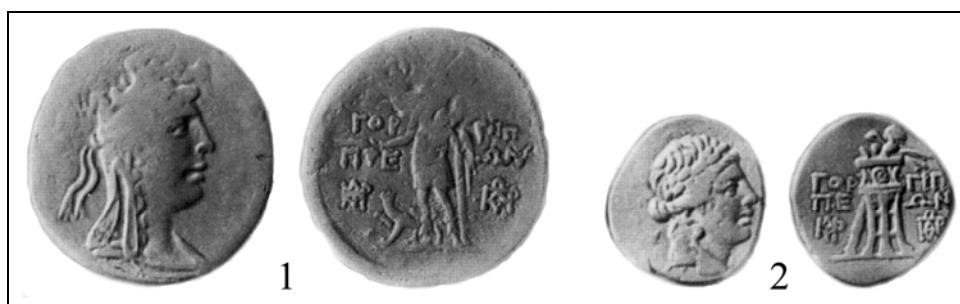
Рис. 7. Обол и тетраchalk Горгиппии с монограммами \text{Ϝ} и \text{ϝ} на реверсе (по Анохин 2011: № 1206, 1207).