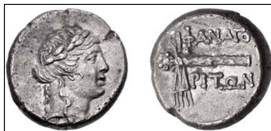
Рис. 10. Драхма Фанагории, выпущенная во время восстания против понтийского владычества (по bosporan-kingdom.com: 63).

Fig. 9. The drachma of Phanagoria with monogram Α on the reverse (after bosporan-kingdom.com: 62).