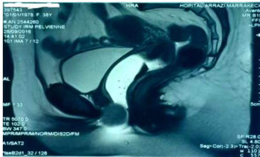
Figure 3:- IRM montrant le Léiomyome urétral.