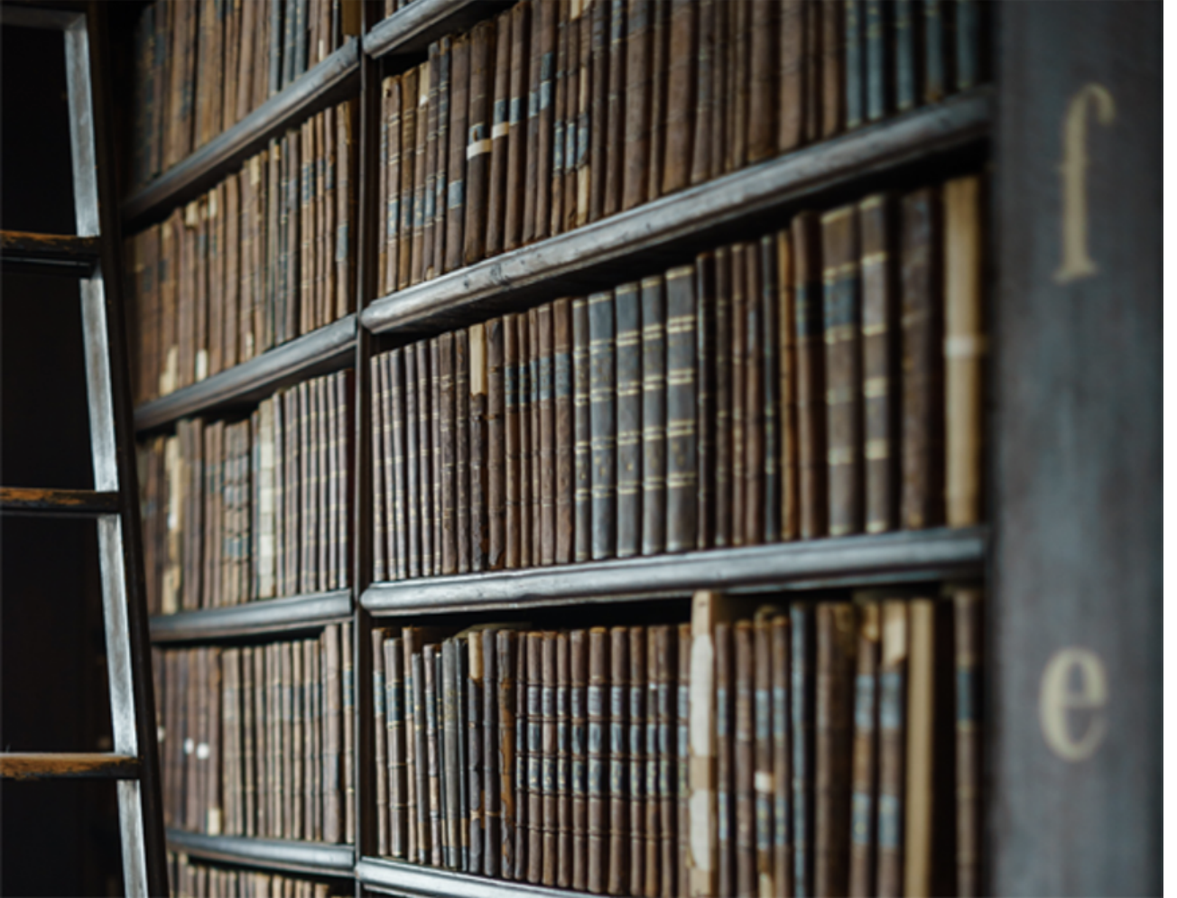
Hukuk Kitapları Kütüphanesi. Malte Baumann, Unsplash, CC0 (orijinalinden kırılmıştır)