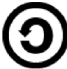
Aynı Lisansla Paylaş

Türetilemez (NoDerivatives) lisans tiplerinden ikisi (BY-ND ve BY-NC-ND) kullanıcıların lisanslı eserin uyarlamalarını paylaşmalarını (daęıtmak veya erişilebilir hale getirmek) sınırlamaktadır. Bu lisans, isteyen herkesin bu lisans kapsamındaki eserleri uyarlayabileceęi, fakat uyarlamaları başkalarıyla paylaşamayacaęı anlamına gelmektedir. Bu, dięer şeylerin yanı sıra, kuruluşların Türetilemez (ND) koşulunu ihlal etmeden metin ve veri madencilięi yapmalarına izin verir.