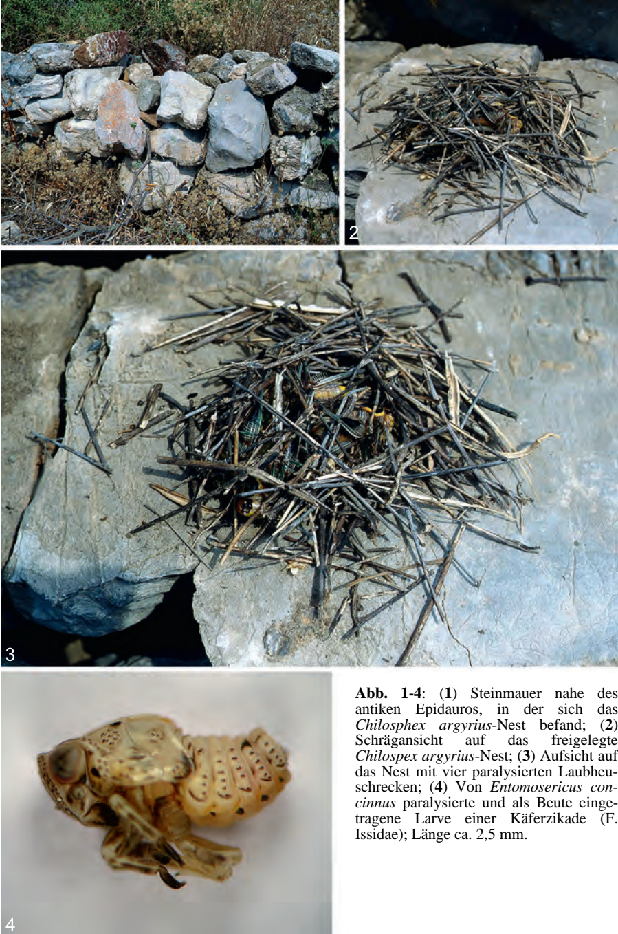
Abb. 1-4: (1) Steinmauer nahe des antiken Epidauros, in der sich das Chilospex argyrius -Nest befand; (2) Schrägansicht auf das freigelegte Chilospex argyrius -Nest; (3) Aufsicht auf das Nest mit vier paralysierten Laubheuschrecken; (4) Von Entomosericus concinnus paralysierte und als Beute eingetragene Larve einer Käferzikade (F. Issidae); Länge ca. 2,5 mm.