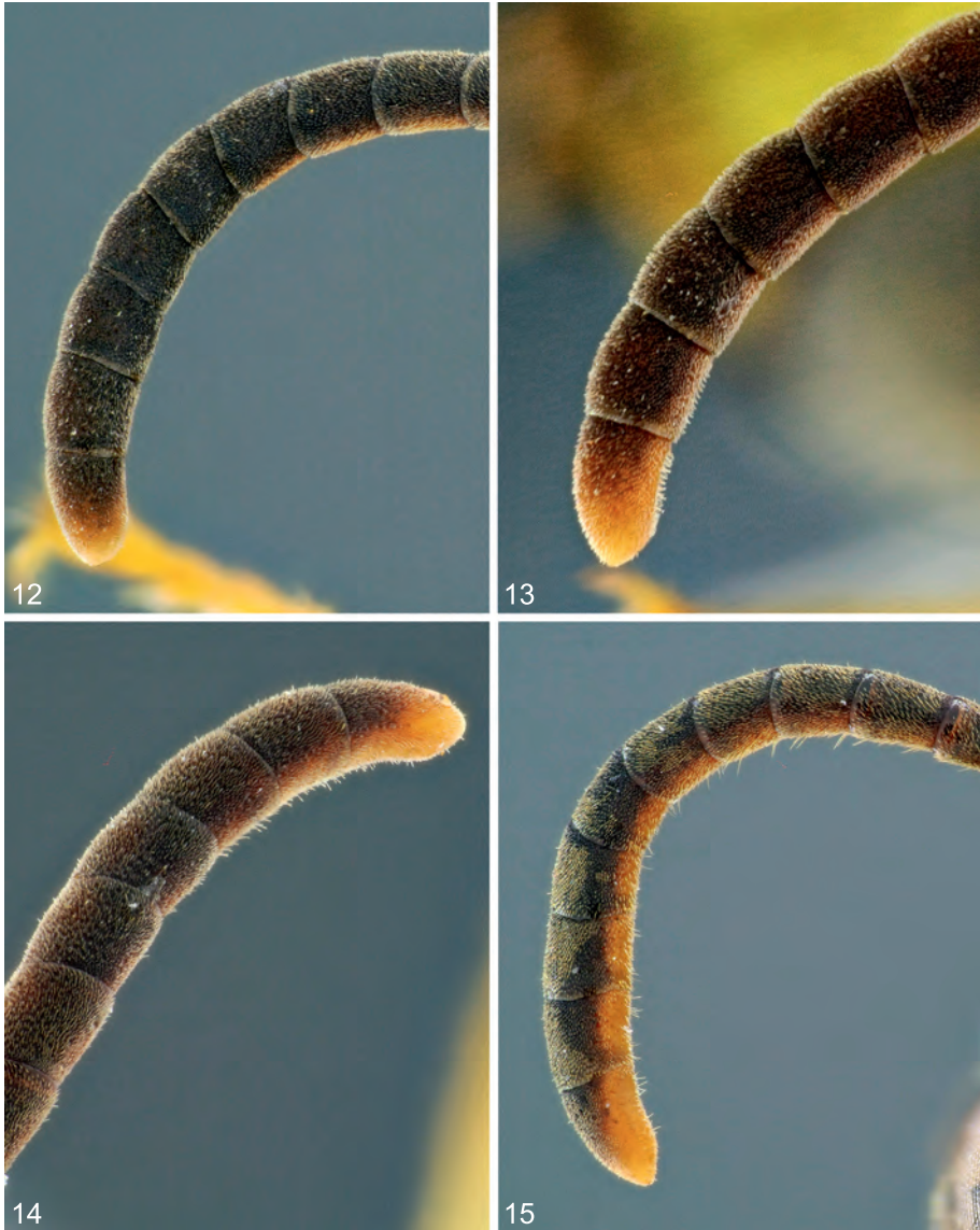
Abb. 12-15: (12) Unbewimperte Fühlerspitze eines Cercheris sabulosa -♂; (13) Fühlerspitze eines Cercheris circularis -♂, mit kurzer Bewimperung auf der Rückseite der distalen Glieder; (14) Fühlerspitze eines Cercheris lunata -♂, ebenfalls mit kurzer Bewimperung auf der Rückseite der distalen Glieder; (15) Fühler eines Cercheris eryngii -♂, mit Bewimperung auf der gesamten Rückseite.