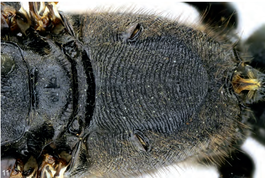
Abb. 10-11: (10) ♂ von Palmodes intermedius nov.sp., Mesonotum, Scutellum und Postscutellum (Paratypus); (11) ♂ von Palmodes intermedius nov.sp., Hinterrand des Mesonotums, Postscutellum und Propodeum (Holotypus).