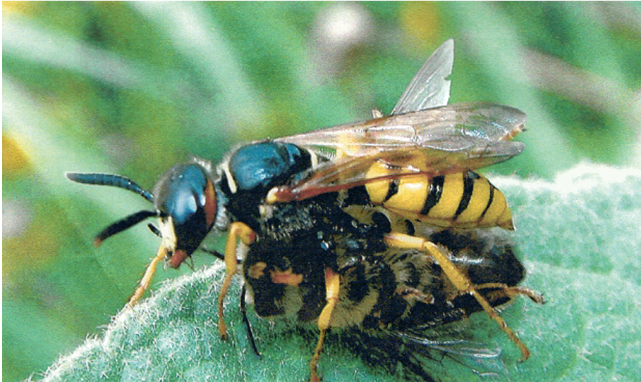
Abb. 2: Philanthus triangulum (F., 1775) mit der klassischen Beute Apis mellifera , 26.VIII.2010.