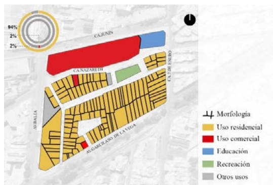
Figura 1: Condiciones de habitabilidad.