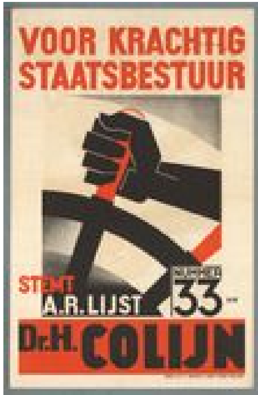
Verkiezingsaffiche ARP, 1933