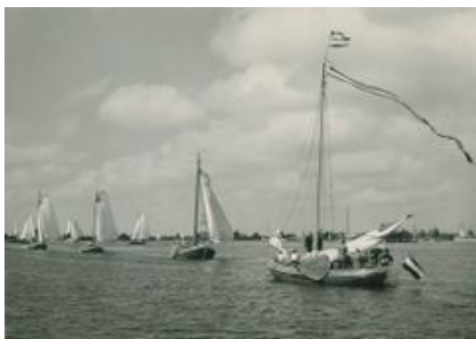
Admiraalzeilen door ronde- en platbodemjachten op het Pikmeer bij Grouw, 1953

'Met zijn dertigen waren zij. De een al mooier dan de ander [...] Statig en sierlijk tegelijk, als waterlelies. Met hun volle, ronde vormen waren zij de koninginnen van dit waterballet, waarop zich allerogen met welbehagen richtten [...] En inderdaad waren de moderne jachtjes, deze dienaressen van de slanke lijn met hun smalle heupen en spitse neuzen, veroordeeld tot de rol van muurbloempjes'. 28