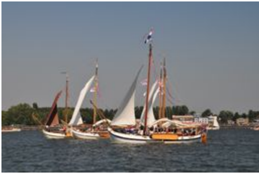
Vlootshow van tjalken

Initiatieven tot het behoud van historische schepen namen na de oprichting van de Stichting Stamboek een vlucht. Zo werd in 1960 de Stichting Botterbehoud opgericht, in de jaren zeventig de Landelijke Vereniging tot Behoud van het Historisch Bedrijfsvaartuig en zagen onder meer aparte behoudsorganisaties voor sleepboten, reddingboten en klassieke scherpe jachten het licht. Vandaag de dag staan ruim 3.000 historische vaartuigen in het Register Varend Erfgoed Nederland van de Federatie Varend Erfgoed Nederland geregistreerd. 47 Een vloot historische vaartuigen van de Federatie is elke vijf jaar in Amsterdam te aanschouwen tijdens het grootste Nederlandse maritieme evenement van onze tijd: SAIL