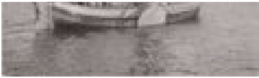
Boeier Jean Bart