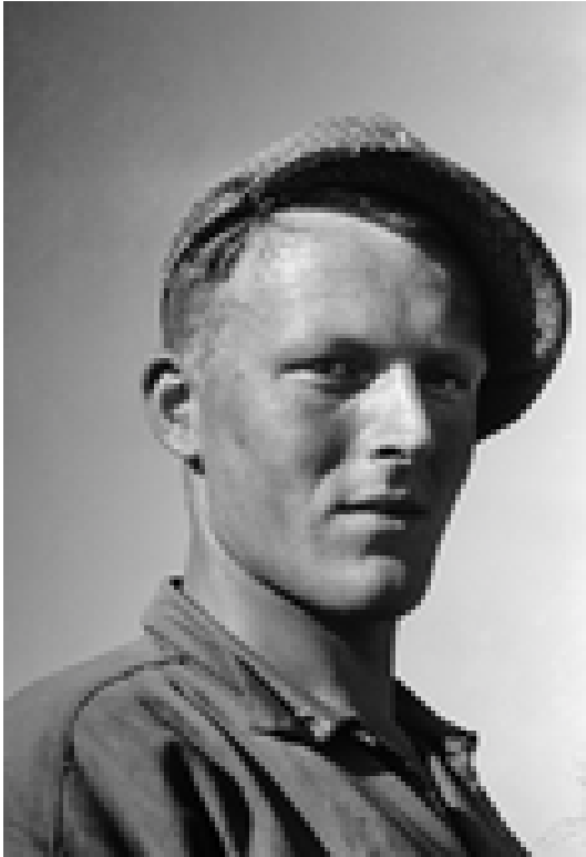
Vissersjongen uit Egmond, 1937-1938

geconstitueerd roeien van Noordzeelanderschap dat het vertrouwen verliezen moest belichamen.