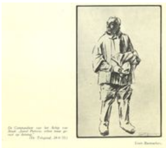
De Commandant van het Schip van Staat [i]

meer hoe het thema van de gezagshandhaving – gevoed door onbehagen over het functioneren van de parlementaire democratie – en níet de economische crisis het politieke debat domineerde en inzet werd van de verkiezingen. 17 Dit was koren op de molen van de ARP, die Colijn onder de leus ‘Voor krachtig staatsbestuur’ opnieuw als sterke man naar voren schoof. Op het verkiezingsaffiche werd wederom een stuurwiel getoond, een abstracte uitsnede deze keer, met een krachtige hand er stevig omheen geklemd. Het beeld van Colijn als krachtdadig en patriarchaal stuurman was inmiddels volledig gecultiveerd, ook buiten de eigen protestantse zuil. Toonaangevende liberale en neutrale kranten als het Algemeen Handelsblad , de Nieuwe Rotterdamsche Courant en De Telegraaf – waarin Colijn op tekeningen van Louis Raemaekers regelmatig in oliegoed of als schipper werd afgebeeld – droegen bij aan de verspreiding van dit beeld. 18 Ook Colijn zélf bekrachtigde zijn imago als sterk stuurman: hij verleende Erich Salomon als eerste fotograaf toegang tot het parlementair debat. Salomons foto’s van een robuuste en stevig gebarende Colijn werden afgedrukt in Het Leven . Geïllustreerd . 19 Mede door toenemende personifiëring en verering werd de politiek leider begin twintigste eeuw een cultureel verschijnsel. 20 Colijn was de eerste staatsman die werd afgebeeld op een verkiezingsaffiche. Niet voor niets werd de ‘schipper naast God’ daarop afgebeeld in een cultureel herkenbare verschijningsvorm.