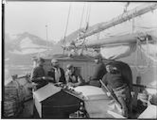
Een deel van de bemanning aan dek van de schoener Willem Barents

kunstenaar, Louis Apol (1850-1936). Apol stond bekend om zijn wintergezichten, en kon nu, in de arctische zomer, vergelijkbare sneeuw- en ijslandschappen vastleggen. De foto's van Grant en Apols tekeningen kregen grote bekendheid, onder meer door reproducties in populaire bladen als Eigen Haard . 39 Apol schilderde ook een doek voor het Panoramagebouw in Amsterdam met een 360° gezicht op Nova Zembla, dat vanaf 1896 voor het publiek te zien was. 40