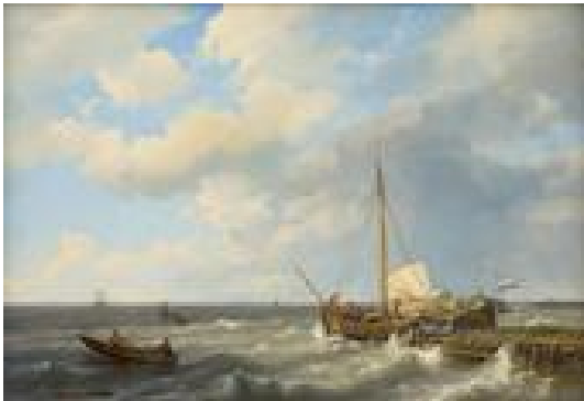
Beurtschip aan lager wal