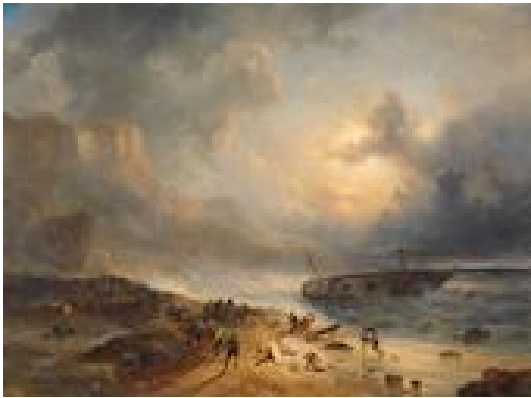
Schipbreuk op een rotsachtige kust

heeft tot duizenden werken door grote en kleine meesters geleid met titels als ‘binnenwater met tjalken’, ‘woelende (of kalme) zee’, en ontelbare strand- en riviergezichten, schipbreuken, overzetveren en pittoreske vissersfamilies. 29 Sommige van die zee- en rivierschilders genoten in hun tijd grote bekendheid of behoorden zelfs tot de avant-garde van de kunst. Jozef Israëls (1824-1911), geen zeeschilder pur sang, werd ook buiten Nederland geprezen om zijn verhalende, nogal sentimentele werken over het harde leven van de vissers aan de Noordzeekust. Zijn collega Hendrik Willem Mesdag (1831-1915), een vertegenwoordiger van de Haagse School, was wel een echte specialist, tot in het extreme: zijn oeuvre bestaat vrijwel uitsluitend uit schilderijen van bomschuiten op of bij het strand van Scheveningen.