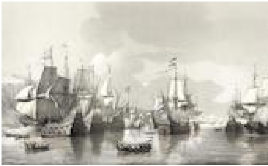
De verovering van de Spaanse Zilvervloot in de Baai van Matanzas, 10 september 1628 [i]

zelfbewustzijn. Nog tot ver na de negentiende eeuw bleven die zeehelden deel uitmaken van de informele canon waarvan het onderwijs en de jeugdliteratuur zich bediende. Liedjes over De Ruyter en Piet Hein, waaronder het bekende Zilvervloot-lied door Jan Pieter Heije (1809-1876) en kinderboeken over hun dapperheid bleven ook in de twintigste eeuw populair. 41 Kritiek op die in hedendaagse ogen overdreven heldenverering was er maar weinig. Slechts een enkele tijdgenoot durfde het bijvoorbeeld aan om de zelfmoord van Van Speijk te kwalificeren als een daad die strijdig was met het christendom. 42 Dat Multatuli (1820-1887) weinig op had met maritiem heldendom zal niemand verbazen. Dat blijkt wel uit een gedicht op Michiel de Ruyter, dat Leentje de Haas, een klasgenootje van Woutertje Pieterse in de gelijknamige roman, inlevert bij Meester Pennewip. In zes coupletten vatte zij hierin het leven van de zeeheld bondig samen, waaronder deze drie: