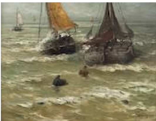
Klaar voor vertrek