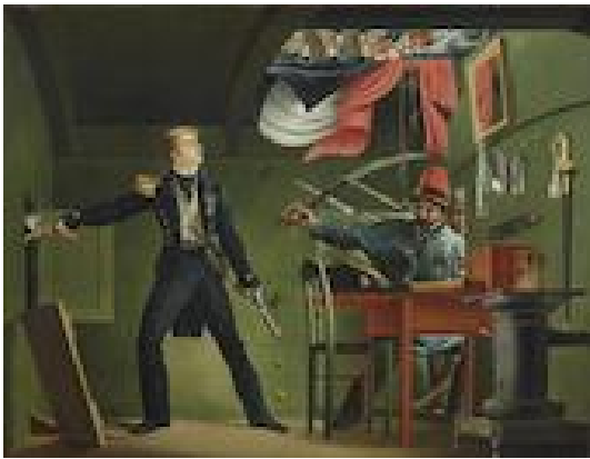
Van Speijk op 5 februari 1831

schepen of vaartuigen van oorlog den naam zal voeren van Van Speijk'. 13 Tot op heden is dat ietwat overhaaste decreet van kracht gebleven. Een monument kwam er ook. Behalve de tombe in de Nieuwe Kerk in Amsterdam, niet ver van het graf van Van Speijks idool Michiel de Ruyter, kwam er een stenen herinnering die letterlijk een lichtend voorbeeld moest zijn voor zeevarenden: de monumentale vuurtoren in Egmond aan Zee, gereedgekomen in 1834. De kosten werden bestreden uit de verkoop van de brokstukken van de kanonneerboot Nr. 2 . De euforie rond Van Speijk was enorm, maar zwakte ook snel af. Na 1835 werden er vrijwel geen schilderijen meer gewijd aan zijn heldendaad. 14 Alleen de Koninklijke Marine zette de Van Speijk-cultus consequent voort. Het Koninklijk Instituut voor de Marine (KIM) in Den Helder ontving het ene aandenken na het andere, zoals schilderijen en relikwieën, waaronder fragmenten van de ontplofte kanonneerboot. Opmerkelijk is ook het Adelborstenlied uit 1887 waarin, naast verwijzingen naar De Ruyter en Tromp ook deze regels voorkomen: 't Voorbeeld door Van Speijk gegeven / Volgen wij met hart en hand'.