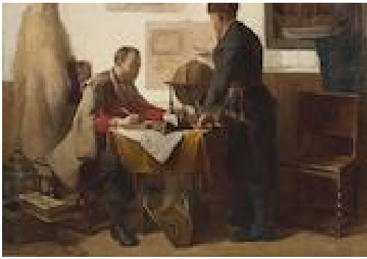
Jacob van Heemskerck en Willem Barentsz beramen hun tweede tocht naar het Noorden, 1595