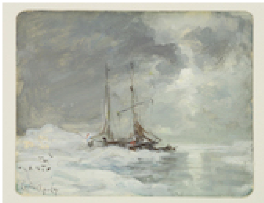
De poolschoener Willem Barents in het ijs in de Noordelijke IJszee