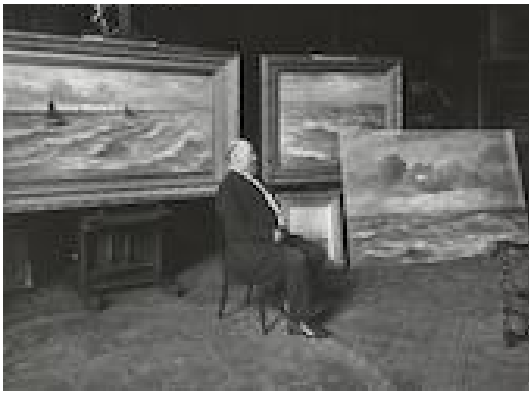
Mesdag in zijn atelier