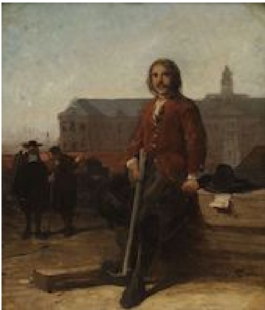
Tsaar Peter de Grote op de Oost-Indische werf in Amsterdam

Links van de zittende Heemskerck hangt een ijsberenhuid, een verwijzing naar de eerste expeditie, toen een ijsbeer werd geschoten bij Nova Zembla. Voor de meeste andere attributen in het vertrek koos de schilder voorwerpen uit een veel latere periode. Schilderij door Christoffel Bisschop, 1860- 1862. Het Scheepvaartmuseum, Amsterdam.