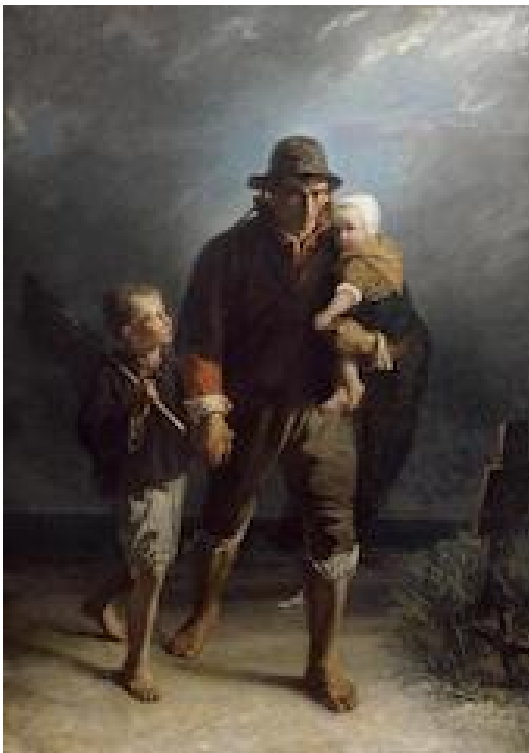
Langs moeder's graf