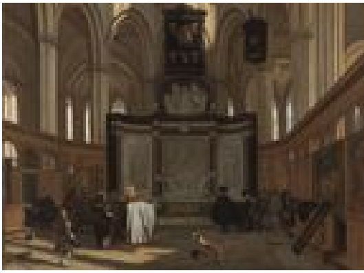
Het praalgraf van Michiel de Ruyter in het koor van de Nieuwe Kerk in Amsterdam