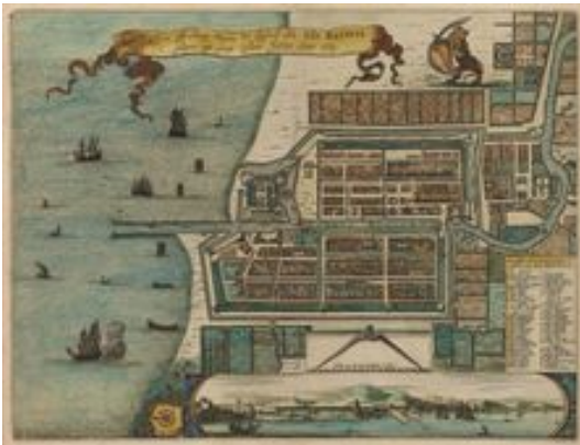
Plattegrond van Batavia