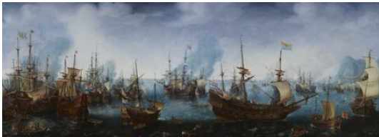
Vorstudie van De slag bij Gibraltar, 25 april 1607