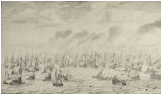
De slag bij Ter Heide waarin admiraal Maarten Harpersz Tromp sneuvelde, 10 augustus 1653