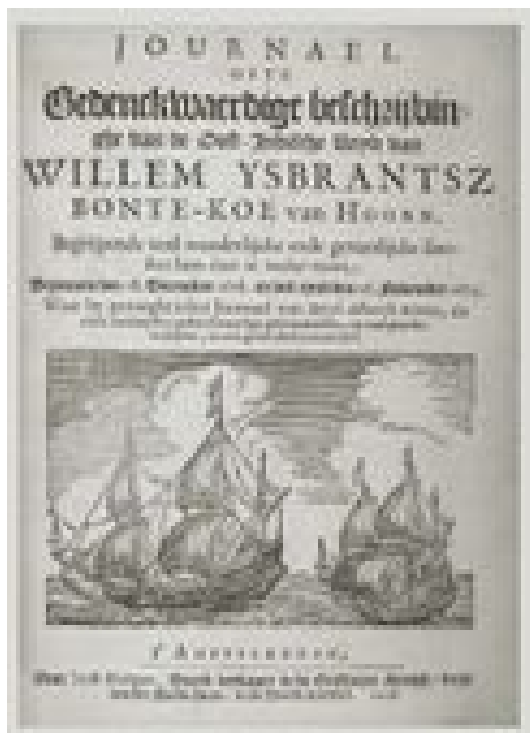
Reisverslag van Willem IJsbrantsz. Bontekoe

luidde een nieuwe periode voor het genre in. In de achttiende eeuw zou deze ontwikkeling leiden tot imaginaire reisverslagen zoals Henrik Smeets' Krinke Kesmes (1708), die ruimte boden voor maatschappijkritiek en zo de inspiratie vormden voor buitenlandse klassiekers als Robinson Crusoe van Daniel Defoe (1719) en Gulliver's Travels van Jonathan Swift (1726). 16 Een ander genre dat bijzonder populair werd in de tweede helft van de Gouden Eeuw was het rijk geïllustreerde koffietafelboek, het specialisme van de Amsterdamse uitgever Jacob van Meurs. Van Meurs publiceerde boeken die waren geschreven door reizigers als Johan Nieuwhof – over Brazilië en China – en broedschrijvers zoals Arnoldus Montanus en Olfert Dapper – over respectievelijk Amerika en Afrika, en die kunnen worden beschouwd als een zelfgenoegzame samenvatting van de opbrengst van de Nederlandse scheepvaart overzee. In de achttiende eeuw zou François Valentijn ( Oud en Nieuw Oost-Indiën , 1726) deze traditie van informatieve, rijk geïllustreerde boeken voortzetten. 17