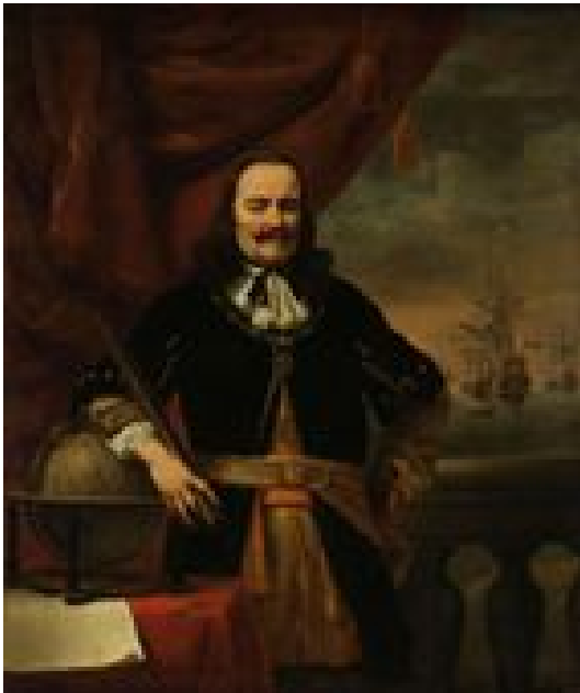
Michiel de Ruyter als luitenant-admiraal