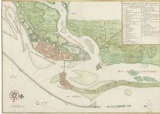
Paskaart van de haven van Recife, Pernambuco, in Brazilië

echter niet vanzelfsprekend, en in de maritieme cultuur van de Gouden Eeuw vallen vooral de overeenkomsten tussen Oost en West op. Stadsplattegronden van Recife (ca. 1643) en Batavia (1652) laten zien dat beide steden uit dezelfde gedachte waren voortgekomen, met de rug naar het binnenland gericht, en de ogen gefixeerd op het water waar de Nederlandse maritieme macht zich moest uitbetalen in militaire overwinningen en economische winst.