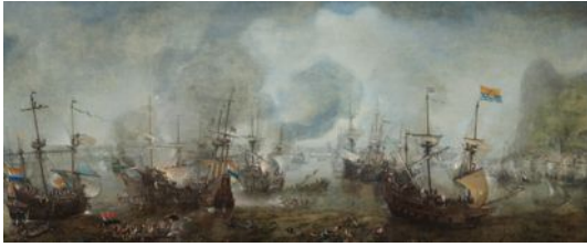
De slag bij Gibraltar, 25 april 1607

... symbool te staan voor de herinnering aan de moed en de onverzettelijkheid die de Republiek in betere tijden zoveel succes hadden gebracht. 1