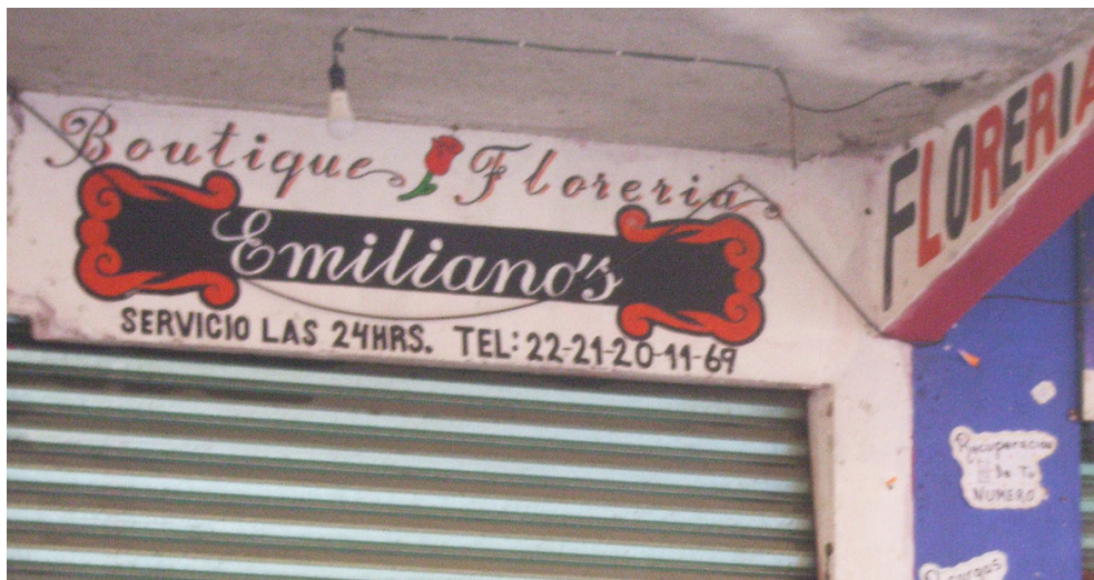
Imagen 3. Texto en tienda con elementos en francés, español e inglés

En cuanto al francés, aparece en un solo caso y se trata de un préstamo generalizado: boutique (cfr. Imagen 3); respecto al malayo, este se da en el nombre de una empresa comercial ( Pakar Zapaterías , indicando que venden productos de su catálogo).