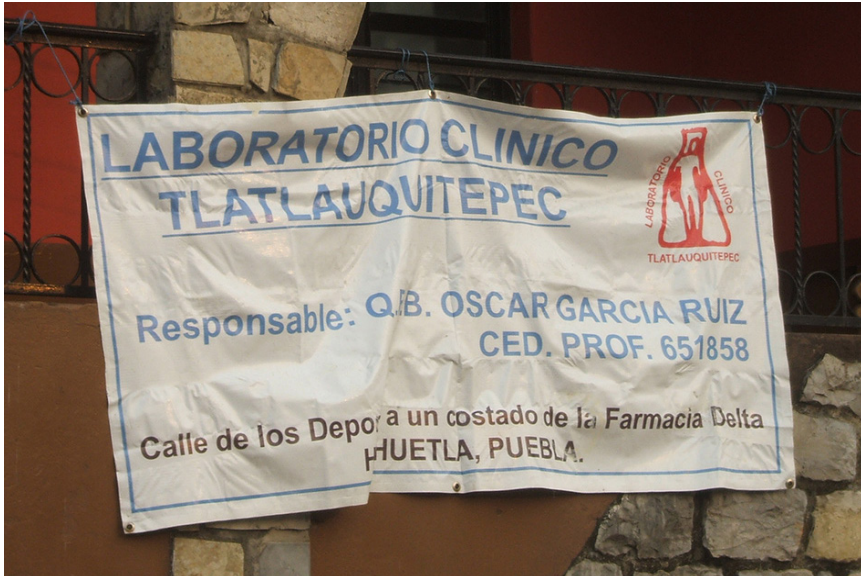
Imagen 4. Texto con toponimia náhuatl

El caso del totonaco es más variado. Lo encontramos de nuevo en la toponimia: Pullanichuchut , Xonalpu , Kuwikchuchut , y en el gentilicio y nombre de la lengua: totonaco , que puede considerarse un préstamo integrado al español. No obstante, a diferencia del náhuatl, esta lengua también aparece en otros contextos.