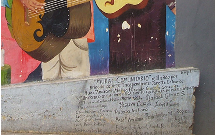
Imagen 8. Leyenda en español en el mural comunitario

En consonancia con los hallazgos de Macalister (2010) para el maorí en Nueva Zelanda, salvo los casos relativos a la toponimia y el préstamo “totonaco”, esta lengua es empleada por actores locales. Sin embargo, a diferencia de sus resultados, no se trata solo de señales no oficiales, sino que en el totonaco de Huehuetla se da una colaboración de actores comunitarios con el gobierno, de manera que también aparece en señales o espacios oficiales. No se sabe qué tanto se mantenga este tipo de colaboración. Otra diferencia con respecto a los resultados de Macalister se refiere al criterio de la permanencia de los textos. En el caso del maorí, eran señales de carácter temporal, que podían ponerse y quitarse; en el caso del totonaco, se trata de textos con un mayor grado de permanencia al ser hechos de un material más durable, estar pintados directamente sobre el muro o estar fijados de algún modo. 8 Finalmente, a semejanza de lo encontrado por Backhaus (2006) y Fernández Juncal (2020:341-342), la traducción mutua entre una y otra lengua en Huehuetla se da preferentemente en aquellas de carácter oficial.