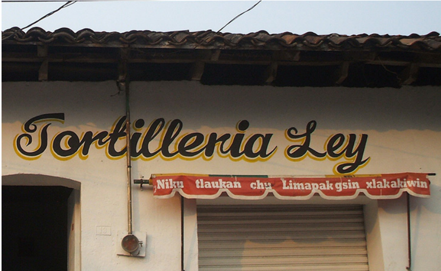
Imagen 5. Exterior de la Tortillería Ley con traducción al totonaco

cómo escribir la lengua: 5 NIKU TLAHUAKAN CHU LIMAPAKGSIN XALAKAKIWIN y niku tlaukan chu Limapakgsin xlakakiwin , que significa literalmente ‘donde se hace tortilla Ley del monte’. En la versión totonaca tan solo se añade un significado cultural, implícito en la versión en español: que se trata de la ley ‘del monte’ (cfr. Imagen 5).