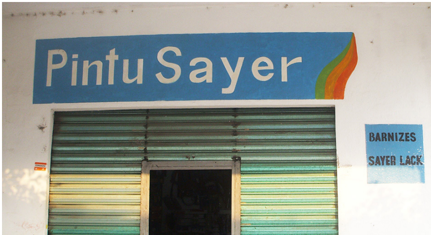
Imagen 2. Tienda con texto en español e inglés

Finalmente, tenemos casos en que elementos léxicos del inglés son empleados directamente, pero, a diferencia del primer caso, no se trata de nombres comerciales altamente difundidos, sino que sirven para nombrar el establecimiento en cuestión. Así, en un caso el nombre dado al negocio está completamente en inglés ( Dentalife ) y en otro se crea un compuesto híbrido español-inglés ( Pintu Sayer ) (cfr. Imagen 2 y 3). De nueva cuenta, no se trata de un fenómeno innovador, pues el recurso al inglés para nombrar tiendas se ha empleado en otras partes (cfr. Pfeiler, Franks & Briceño 1990; Baumgardner 2006:257). Resulta, sin embargo, llamativo encontrarlo en una localidad pequeña.