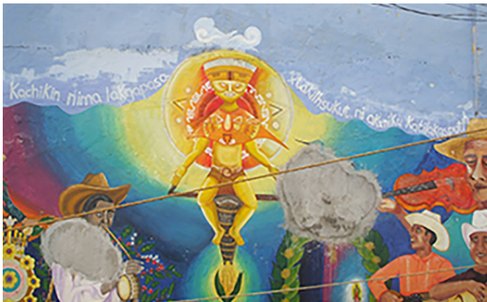
Imagen 7. Mural comunitario totonaco-español