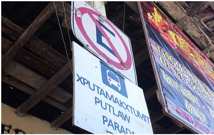
Imagen 6. Señal de tránsito totonaco-español

que en el caso de estos textos, además de las autoridades gubernamentales, interviene una institución educativa que busca promover el uso de las lenguas indígenas con el apoyo de profesores y alumnos (cfr. Imagen 6). 6 Finalmente, se registró un mural realizado en 2016 por actores comunitarios con la leyenda arriba Akgtum kachikin nima lakgapasa xtakilhsukut ni akxniku katilakgspulth , y su traducción abajo en la esquina Un pueblo que se identifica con su cultura es un pueblo invencible . En la pintura quedaban representados elementos de la cultura totonaca (cfr. Imagen 7 y 8). A pesar de ser un mural comunitario, estaba ubicado en la pared lateral del Palacio municipal; de ahí que lo consideremos como propio del ámbito gubernamental. Tenemos aquí, pues, otro tipo de agente que actúa en colaboración con el gobierno. 7