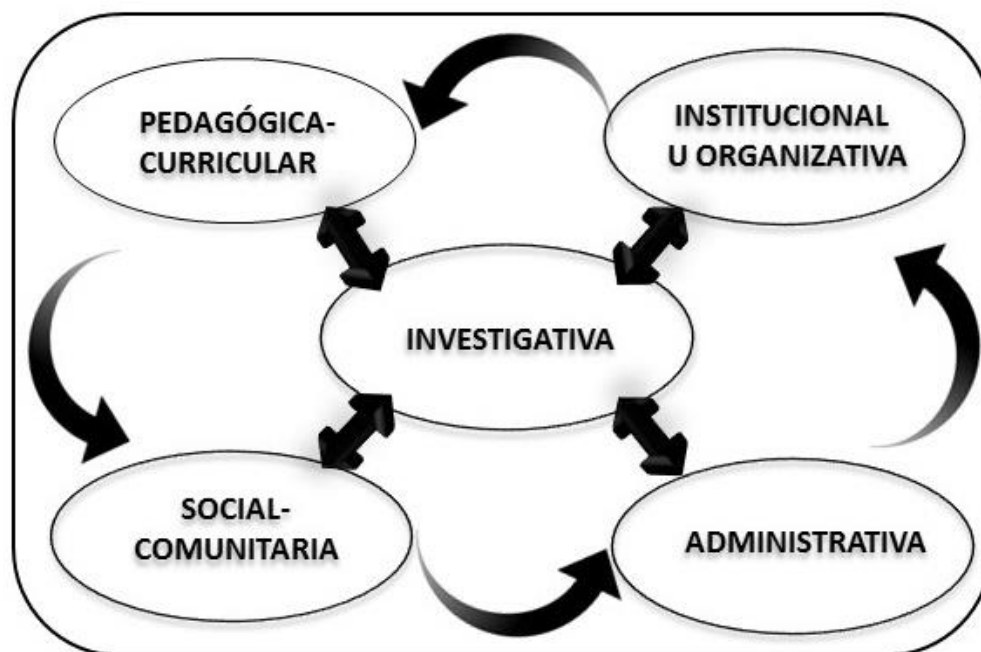
Figura 1. Dimensiones de la gestión educativa

Sobre la base de lo referido, se han seleccionado las dimensiones pedagógica-curricular, institucional u organizativa, administrativa, social-comunitaria e investigativa como aquellas que desde la perspectiva de la autora se consideran apropiadas para desarrollar la gestión educativa. En la Figura 1 se representan gráficamente tales dimensiones.