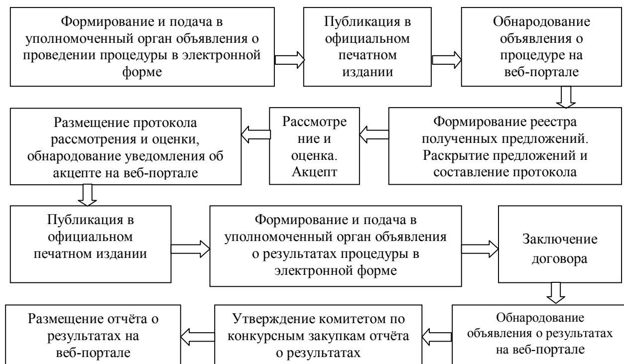
Рис. 6. Порядок организации и проведения открытого конкурса в ДНР

По итогам 9 месяцев 2018-2020 гг. количество проведённых процедур государственных закупок в разрезе видов представлено в табл. 3.