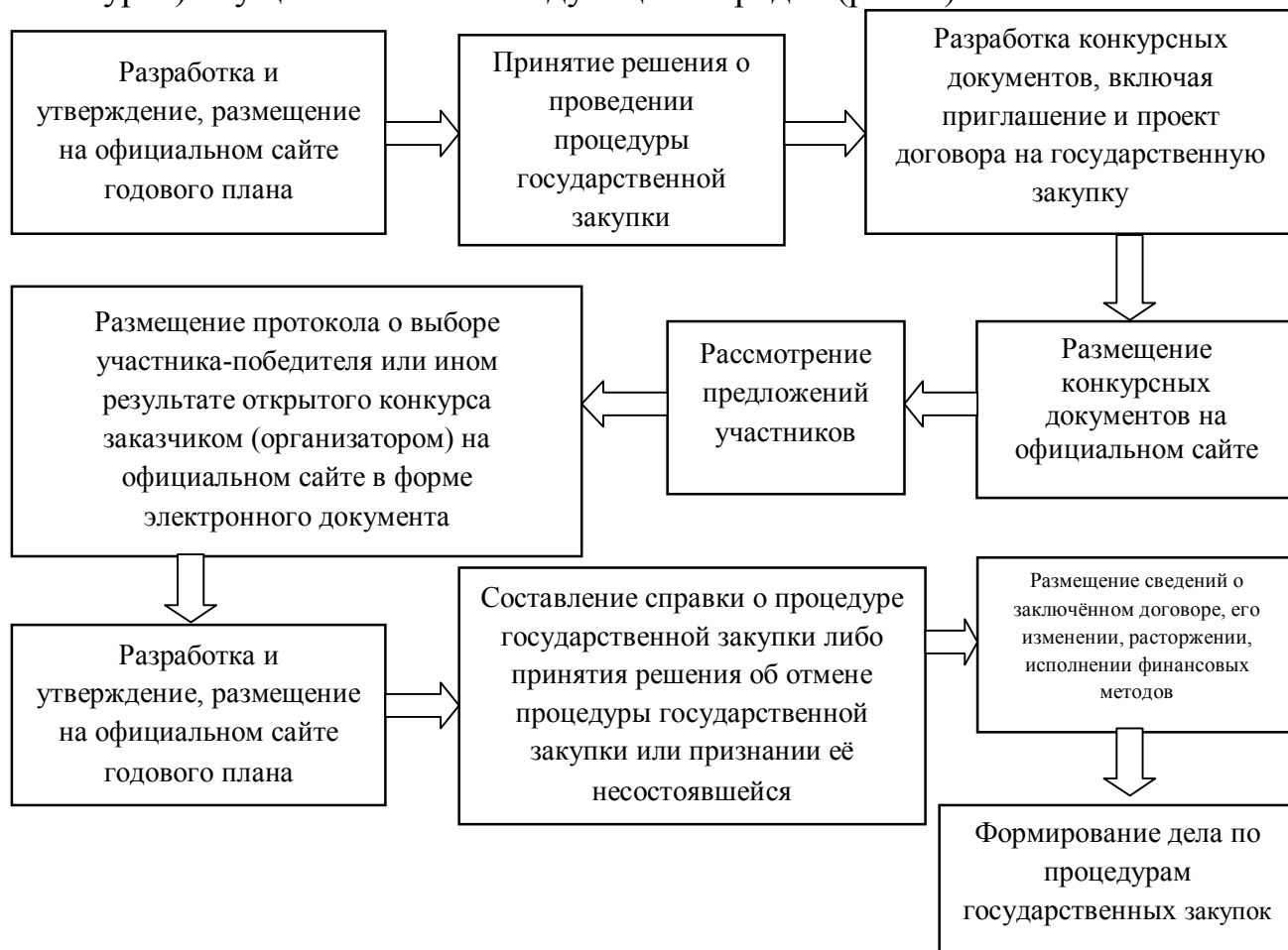
Рис. 4. Порядок организации и проведения открытого конкурса в Республике Беларусь

Организация и проведение процедур закупок (на примере открытого конкурса) осуществляется в следующем порядке (рис. 4).