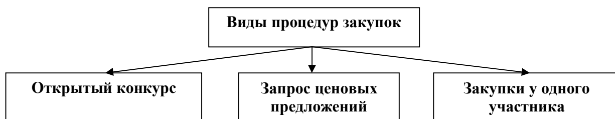
Рис. 5. Виды государственных закупок в ДНР

Действующим законом ДНР установлены следующие виды закупок (рис. 5).