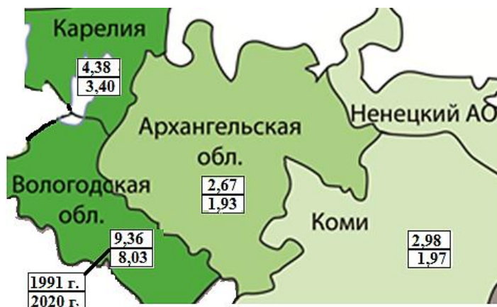
Рис. 1. Плотность населения в субъектах региона в 1991 г и 2020 г, чел/км 2

постепенно увеличивается. В абсолютных единицах Архангельская область имеет самое высокое значение потерь населения. Анализ динамики структуры населения показывает, что доля городского населения наиболее увеличилась в Вологодской области, в Коми всего лишь на 2%, а в Карелии даже наблюдается, пусть и незначительное (около 1%), повышение доли сельского (https://rosstat.gov.ru/compendium/document).