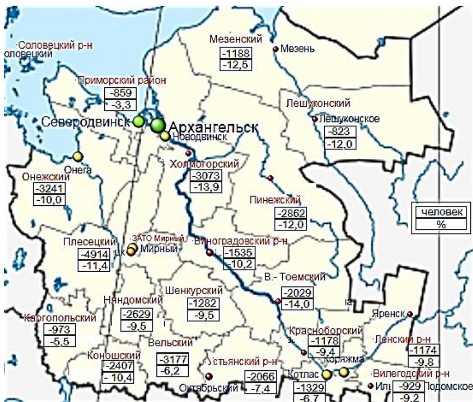
Рис. 2. Показатели изменения численности населения по муниципальным районам