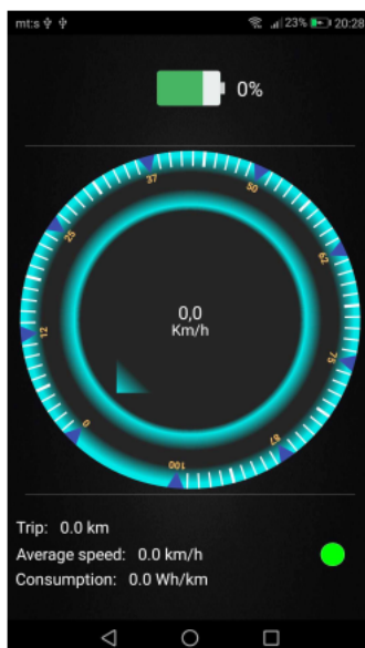
Slika 5. Korisnički interfejs razvijene Android aplikacije u okviru projekta električnog bicikla H-Bridges tima

Iako je navedeni postupak na prvi pogled jednosmeran, prosečan korisnik pri pokušaju realizacije navedenog rešenja može naići na mnogobrojne probleme.