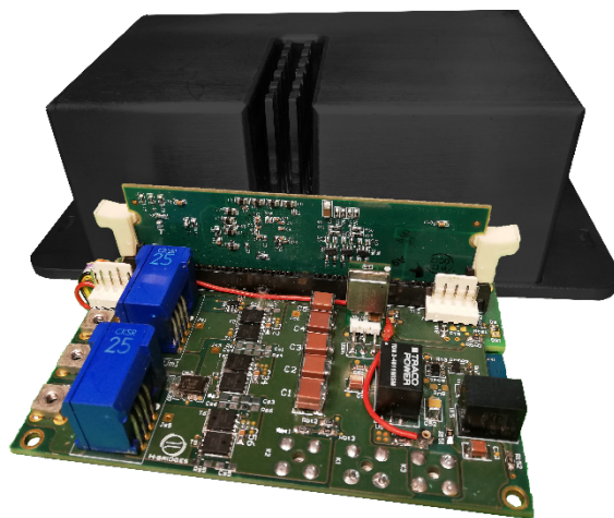
Slika 4. Razvijeni otvoreni prototip invertorske jedinice u okviru H-Bridges tima za električni bicikl

Nakon ispravnog povezivanja sistema u okviru invertorske jedinice se izvršava kontrolni algoritam, bez posredstva korisnika, koji na bazi prikupljenih informacija (sa baterije, ručice za gas i električne mašine) na obodu točka korisniku pruža željenu vučnu silu.