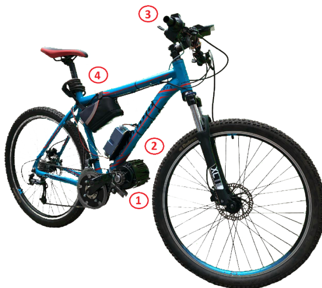
Slika 1. Realizovani električni bicikl u okviru H-Bridges tima na Elektrotehničkom fakultetu u Beogradu sa osnovnim elementima: 1) električna mašina, 2) invertorska jedinica, 3) ručica za gas i 4) baterija

Pored projekta električnog bicikla koji će u poglavlju III biti detaljnije predstavljen, projekti koji su takođe delom ili potpuno otvoreni nalaze se u Tabeli 1. To su projekat brzog punjača za baterije sa galvanskom izolacijom, sistem napajanja nanosatelita i drugi. Hardverska i softverska tehnička rešenja koja su nastala kao rezultat projekata navedenih u Tabeli 1 sistemski su integrisana u različite aktivnosti rada studentskog tima i kontinualno se koriste u nastavi.