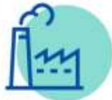
INDUSTRIAL & MANUFACTURING