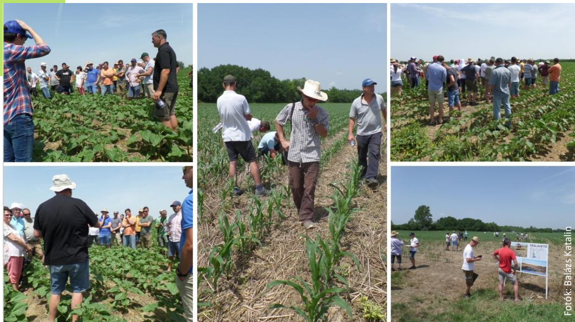
Innovatív termelők nyílt napokon osztják meg a tapasztalataikat