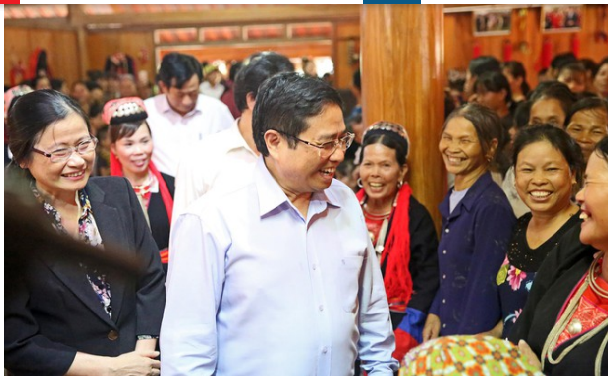
Ông Phạm Minh Chính trò chuyện với người dân xã Bằng Cả, huyện Hoàn Bô, tỉnh Quảng Ninh

Sau này thời gian đã vùn vụt trôi cùng bao biến đổi thế thời này khác của lòng người thói đời, mới thoáng giật mình nhớ lại cái câu của tiền nhân mà mình đã từng quen dùng và Phạm Minh Chính từng nhắc lại ấy. Có phải chăng câu " cùng tắc biến, biến tắc thông " đã rành rẽ một thông điệp. Nào có chi mà phải hoang mang. Rằng Romania nói riêng và Đông Âu thời điểm ấy như tận cùng của sự đổi thay là kéo theo bao biến đổi. Mà tận cùng sự biến ấy tình thế rồi sẽ khác? Như Cụ Hồ nhà mình đã dung dị trong mấy câu thơ: " Sự vật xoay vần đà định sẵn/ Hết mưa lại nắng hừng lên thôi/ Hết khổ lại vui vốn lẽ đời! "