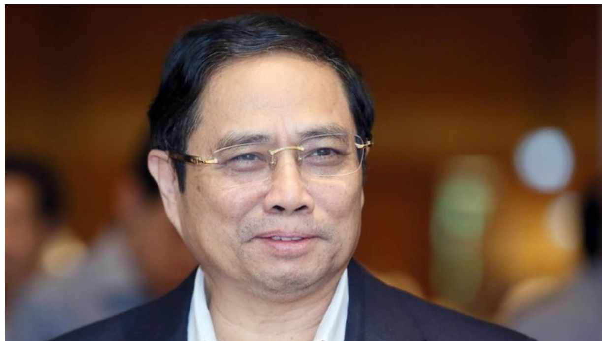
Tân Thủ tướng Phạm Minh Chính