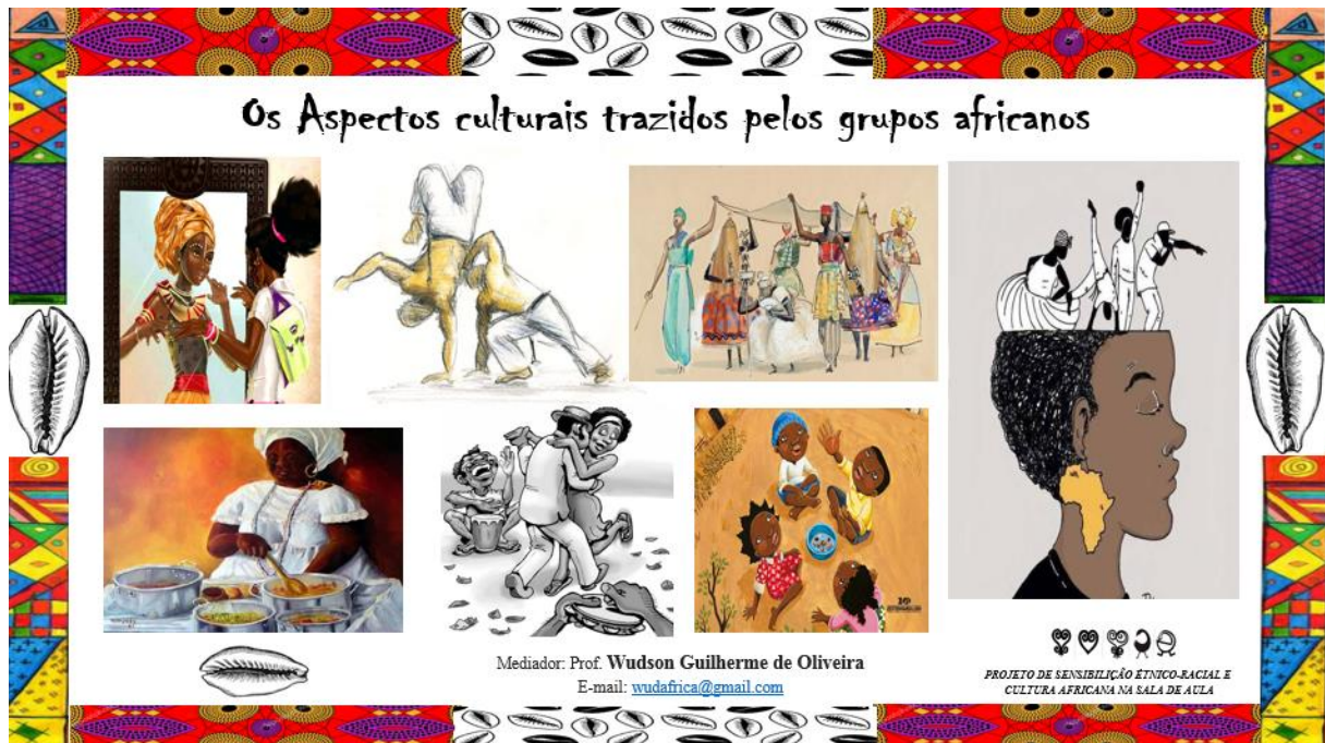
Figura 6. Imagem do Slide sobre os aspectos culturais introduzido no Brasil pelos Povos Bantu . Fonte e Arte: Wudson Guilherme de Oliveira (professor).