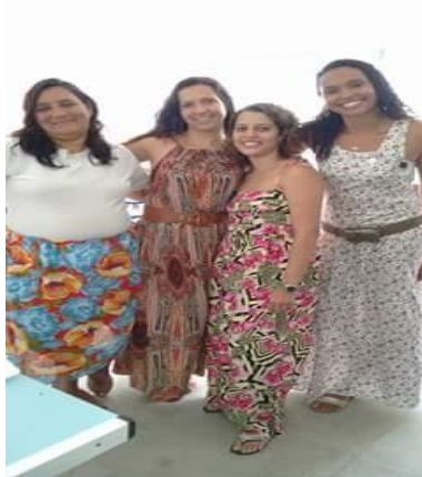
Professoras do 4º ano e 5º ano