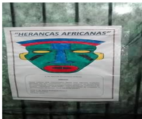
Explicação das Máscaras Africanas