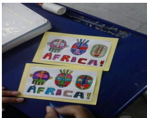
Convite elaborado pelos alunos