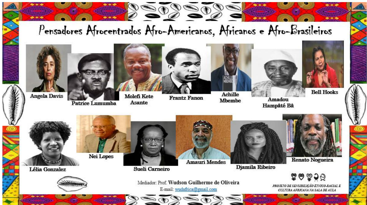
Figura 3. Imagem do Slide sobre os “Filósofos (as) e Pensadores afrocentrados e decoloniais”. Fonte e Arte: Wudson Guilherme de Oliveira (professor).

Vale enfatizar, que nas “Aulas/Oficinas”, a sala de aula estava sempre ambientada com tecidos de temáticas africanas, bonecas (os) negras (os), instrumentos de percussões e Exposições de Livros Africanos, Indígenas e Afro-Brasileiros, com o objetivo de possibilitar aos Estudantes um maior contato com estes materiais e contribuir assim com a cidadania para uma sociedade mais justa. Durante as “Aulas/Oficinas”, ocorreram a distribuição de revistas de História da Biblioteca Nacional e sorteio de livros de literaturas afro-brasileiras e indígenas para os participantes, possibilitando um maior contato entre o Docente e os Estudantes na troca de saberes. Sempre ao término das apresentações, eram fomentadas as “Rodas de Diálogos” sobre as impressões e desafios encontrados para fazerem as pesquisas, oportunizando trocas de olhares em relação as perspectivas da Filosofia Africana.