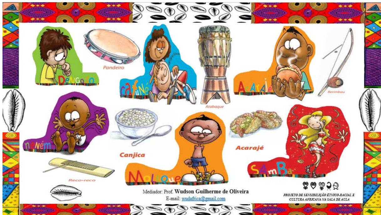
Figura 5. Slide sobre algumas das palavras incorporadas no português brasileiro pelos Povos Bantu . Fonte e Arte: Wudson Guilherme de Oliveira (professor).

No Brasil, existe grande predominância da contribuição vocabular dos grupos diásporicos falantes das línguas banto, notadamente o umbundo, o quimbundo e o quicongo. Porventura é desses idiomas originários do continente africano, que provavelmente eternizaram palavras de tronco linguístico denominado banto, onde grande quantidade delas, conhecemos e as utilizamos como, por exemplo: axé 82 , banzo 83 , boboca, bugiganga, ginga, cabaça, cafuné, caçula, cachaça, cochilo, dendê 84 , dengue, fofoca, fuzuê, jiló, lemanjá, macumba, moleque, orixá, Oxalá, pururuca, quilombo 85 , quitanda 86 , quiabo, sopapo, toco, samba, sunga, tagarela, Zumbi, zangado e milhares de outras palavras influenciaram de modo positivo a língua portuguesa no Brasil e a cultura dos Povos Bantu ainda invisibilizada em nossa sociedade.