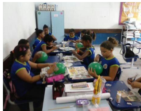
Confecção das Máscaras Africanas