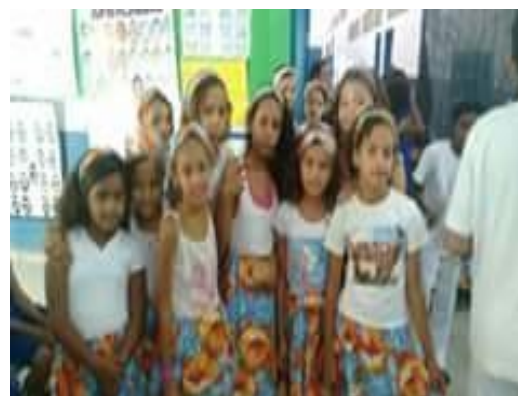
Apresentação de Jongo