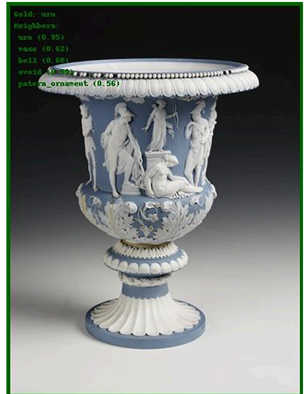
Abbildung 4: Eine Sèvres-Kopie der Medici-Vase stößt die Klassifizierung mit assoziativen Labeln an

Nicht auszuschließen ist hier zudem ein Effekt des visuellen Klassifikators, wie auch Abb. 5 zeigt. Die Fehlklassifizierung des Objekts, eines Nähtischchens, führte zu konsistenten Zuschreibungen im Bereich der Sitz- und Liegemöbel. Betrachtet man die äußere Form des Artefakts auf einer abstrakteren Ebene, kann man eine visuelle Nähe zu z.B. einem (Double-)Camel-back Sofa durchaus nachvollziehen.