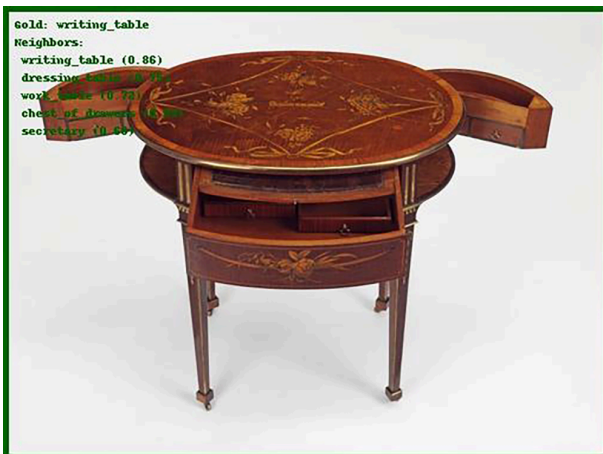
Abbildung 3: Abweichungen bei der Klassifizierung desselben Objekts