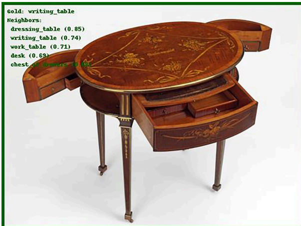
Abbildung 2: Abweichungen bei der Klassifizierung desselben Objekts