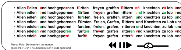
Abbildung 3: Mehrfacher Schriftstrom, hier: variante Überlieferung mit Normalisierungsstufen.

Erste Experimente zur Darstellung von varianten Fassungen, Normalisierungsschritten in der Transkription oder Visualisierung der semantischen oder Rhythmusstruktur in den Nebensatzkonstruktionen (z.B. in literarischen Werken wie bei Thomas Bernhard) deuten bereits an, dass sich hier jenseits der übersetzenden Reproduktion auch erhebliche produktive und innovative Kräfte entfalten könnten. Denn, Aphorismussektion: Alle neuen Medien müssen nicht nur ihre Formen erst noch finden, sondern auch ihre spezifischen Funktionen.