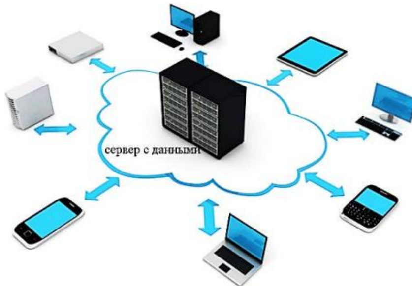
Рис. 2. Концепция облачных технологий

Облачные технологии, как отмечает Т. В. Гришанова, имеют характеристики, которые показаны на рис. 3.