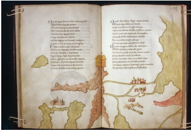
Harvard University, Houghton Library, MSTyp155-rnets