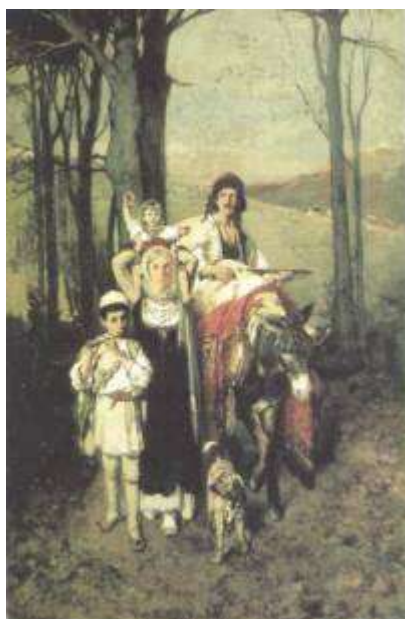
Εικ. 4. Νικηφόρος Λύτρας, Η Επιστροφή, από το Πανηγύρι, Εθνική Πινακοθήκη

Μέσα στα ίδια πλαίσια, η ζωγραφική των Λύτρα, Γύζη, Ιακωβίδη είναι ηθογραφική, αντλεί τα θέματά της από τα ήθη και τα έθιμα της ελληνικής υπαίθρου και εξιδανικεύει τις καθημερινές σκηνές και τις ασχολίες των αγροτών σε μνημειακούς πίνακες. Τυπικό δείγμα των αντιλήψεων, τεχνοτροπικών και ιδεολογικών, που επικρατούσαν στην ελληνική ζωγραφική της εποχής αυτής, αποτελεί το έργο του Νικηφόρου Λύτρα Επιστροφή από το Πανηγύρι της Πεντέλης (εικ.4). Η ρεαλιστική αντιμετώπιση της γεωργοκτηνοτροφικής κοινωνίας που τόσο απείχε απ' αυτή την ωραιοποιημένη εικόνα, ήταν αυτή την εποχή μακριά από τη σκέψη των Ελλήνων. Η αναζήτηση της αλήθειας περιοριζόταν μόνο στην νατουραλιστική απεικόνιση των λεπτομερειών και στην ανεκδοτολογική διήγηση των γεγονότων[9].