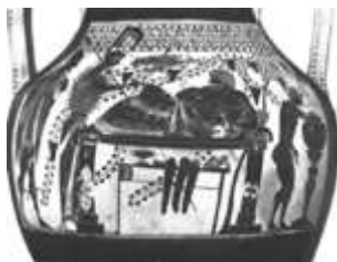
Εικ. 7: Δίγλωσσος αμφορέας του ζωγράφου του Ανδοκίδη. Μελανόμορφη όψη με την μελανόμορφη παράσταση, περίπου 510 ΠΚΕ.

Στην εικόνα 6 βλέπουμε έναν αττικό ερυθρόμορφο αμφορέα του Ευθυμίδη, φιλοτεχνημένο περί το 510-500 ΠΚΕ Απεικονίζεται ο Έκτορας να παίρνει τα όπλα του για την μάχη από κάποιον, παρουσία του γέροντα Πριάμου[42]. Οι πτυχώσεις των ενδυμάτων σχηματίζονται με λεπτές πυκνές γραμμές και καταλήγουν σε ζιγκ-ζαγκ. Ούτε σε αυτήν την παράσταση υπάρχει βάθος χώρου, όμως οι μορφές δείχνουν να έχουν περισσότερο όγκο.