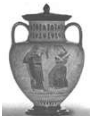
Εικ. 5: Μελανόμορφος αττικός αμφορέας του ζωγράφου του Άμαση, περίπου 540 ΠΚΕ.