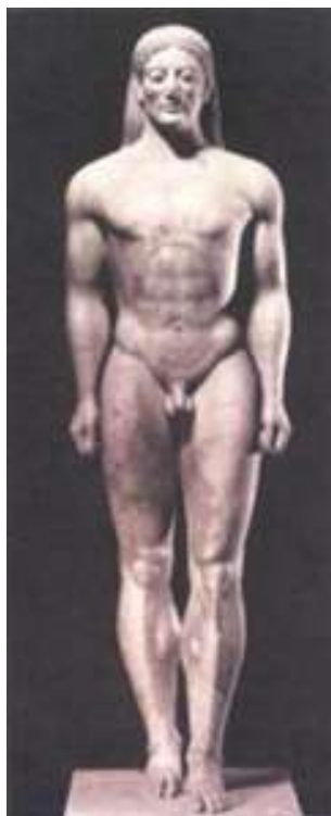
Εικ. 3: Κούρος Αναβύσσου, περίπου 530 ΠΚΕ.

Φαίνεται, λοιπόν, πως η έντονη άμιλλα για οικονομική υπεροχή και πλουτισμό ενθάρρυναν το εμπόριο και τις επικοινωνίες μεταξύ των λαών και, κατ' επέκταση, την ανάπτυξη της τέχνης, μια και μέσα από την απόκτηση έργων τέχνης και ειδών πολυτελείας, όπως θα λέγαμε σήμερα, μπορούσαν οι ηγεμόνες να επιδεικνύουν την κοινωνική και πολιτιστική τους υπεροχή.