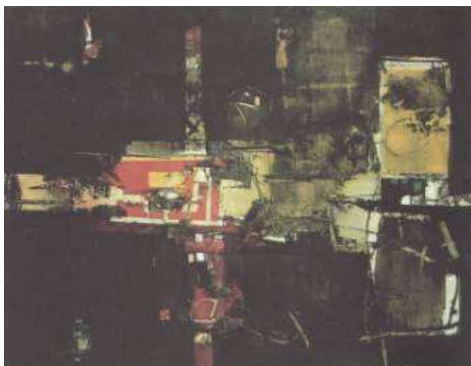
Εικ. 9. Γιάννης Σπυρόπουλος

Το ρεύμα της Αφαίρεσης όμως είχε μια σχετικά περιορισμένη επιρροή στην ευρωπαϊκή τέχνη ανάμεσα στο 1910 και το 1940. Αντίθετα, η αμερικανική της εκδοχή, ο Αφηρημένος Εξπρεσιονισμός, πέτυχε μέσα σε λιγότερο από μια δεκαετία να επιβάλει μια σαρωτική παρουσία στις διάφορες εθνικές τέχνες σε παγκόσμια κλίμακα. « Το εκφραστικό λεξιλόγιό του διεύρυνε εκείνο της ευρωπαϊκής αφαίρεσης, κυρίως στο θέμα της σύνθεσης, της διαδικασίας και των διαστάσεων »[18]. Κύριος εκπρόσωπος του Αμερικανικού Εξπρεσιονισμού ο Τζάκσον Πόλοκ, στα έργα του οποίου το χρώμα μοιράζεται τον κυρίαρχο ρόλο με τη γραμμή, αλλά την ισχυρότερη εντύπωση δημιουργεί η υλική υπόσταση του χρώματος με την πηχτή υφή του που στεγνώνοντας δίνει «ανάγλυφα» αποτελέσματα. Μια άλλη τάση της Αφαίρεσης στην Αμερική είναι η Γεωμετρική Αφαίρεση. Ονομάστηκε και Μεταζωγραφική επειδή τα υλικά και οι μηχανικοί τρόποι τοποθέτησής τους στο εικαστικό πεδίο δημιουργούν την εντύπωση του γραφιστικά κατασκευασμένου.