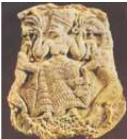
Εικ. 2: Ελεφάντινο ανάγλυφο με ολοφάνερα τα χαρακτηριστικά της αιγιακής τέχνης. Βρέθηκε στην Ουγκαρίτ και εικονίζει καθισμένη γυμνόστηθη θεά πλαισιωμένη από δύο ανορθωμένους αίγαγρους.

Το συστηματικό εμπόριο ανάμεσα στην Κρήτη και τις Κυκλάδες έκανε τους ερευνητές να μιλούν για μινωικό αποικισμό ή τουλάχιστον εκμινωισμό του κυκλαδικού πολιτισμού, την λεγόμενη μινωική θαλασσοκρατορία ( rax minoica )[2]. Οι επαφές της Κρήτης με το Αιγαίο εκδηλώνονται κυρίως με τις αυξανόμενες εισαγωγές μινωικής κεραμικής, την υιοθέτηση αρχιτεκτονικών στοιχείων κρητικού τύπου και, επιπλέον, στα Κύθηρα, την Θήρα, την Μήλο και την Κέα, με την παρουσία σημείων της γραμμικής γραφής Α' [3]. Στις Κυκλάδες υπάρχει αύξηση της εισαγωγής μινωικών αγγείων, χωρίς όμως η επιχώρια κεραμική να χάνει τις ιδιαιτερότητές της. Μιμείται τους μινωικούς ρυθμούς στα μοτίβα διακόσμησης – με φυτικά κοσμήματα, φυτικές ζώνες, σπείρες κλπ. (φυτικός ρυθμός) – στην τεχνοτροπία (του σκοτεινού επί ανοικτού) και στα σχήματα (ψευδόστομοι αμφορείς, ευρύστομες πρόχοι, ρυτά κ.λπ.)[4]. Η παρουσία μινωικών ευρημάτων, όμως, σ' έναν οικισμό δεν δηλώνει απαραίτητα την ύπαρξη μινωικής παρουσίας, αλλά ούτε και μια άμεση μινωική «επίδραση». Ουσιαστικά, ο λεγόμενος μινωικός αποικισμός στις Κυκλάδες συνίσταται πιθανότατα σε έναν έλεγχο που άφηνε στα νησιά κάποια πολιτική αυτονομία, αλλά επέτρεπε στην Κρήτη, μέσω των αντιπροσώπων της, να διατηρεί ή να επαυξάνει τα εμπορικά της συμφέροντα[5].