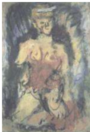
Εικ. 6. Γιώργος Μπουζιάνης, Γυμνό (Θεατρίνα), Εθνική Πινακοθήκη

Στον καλλιτεχνικό χώρο η «ακαδημαϊκή» ζωγραφική έδωσε σταδιακά τη θέση της σε καλλιτέχνες που έρχονταν σε επαφή με τις νέες τάσεις. Οι καλλιτέχνες αυτοί επηρεάστηκαν από τα κινήματα του κυβισμού, του υπερρεαλισμού και του εξπρεσιονισμού, κινήματα που όριζαν με διαφορετικό τρόπο το καθένα τη θέση του ατόμου μέσα στον κόσμο. Πράγματι, μια από τις βασικές επιπτώσεις της βιομηχανικής επανάστασης είναι η ρήξη της κλειστής κοινωνικοοικονομικής και ιδεολογικής κοινότητας και η συγκέντρωση μεγάλου πληθυσμού στα συνεχώς επεκτεινόμενα αστικά βιομηχανικά κέντρα. Αυτό το γεγονός προκαλεί διφορούμενα συναισθήματα στον άνθρωπο, συναισθήματα απομόνωσης αλλά και ανεξαρτησίας, μοναξιάς αλλά και ελευθερίας, και καλείται πλέον αυτός να βιώσει τον εαυτό του ως άτομο, ως αυτόνομη φυσική αξία, και ως εκ τούτου να επανακαθορίσει τις σχέσεις του με τον κόσμο, άψυχο και έμψυχο, σχέσεις που μέχρι τώρα τις καθόριζε η κοινότητα και είχαν συλλογικό χαρακτήρα. Σε τελευταία ανάλυση, η μοντέρνα τέχνη δεν είναι τίποτα άλλο παρά η προσπάθεια που καταβάλλει το άτομο να αυτοκαθορισθεί ως αυτόνομο υποκείμενο[10].