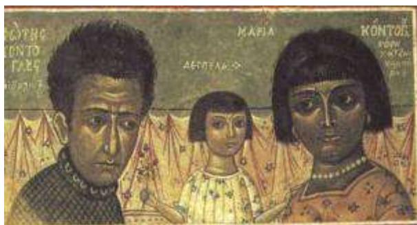
Εικ. 7. Φώτης Κόντογλου, Κτητορική

Αν δεχτούμε ως ορόσημο την μικρασιατική καταστροφή και την τραυματική εμπειρία που προκάλεσε, μπορούμε να συνδέσουμε κάποιες αλλαγές που παρατηρούνται τώρα στην ελληνική ζωγραφική μ' αυτό το βίωμα. Η στροφή προς την παράδοση ταιριάζει εξάλλου απόλυτα με το γενικότερο μεταπολεμικό κλίμα σ' ολόκληρη την Ευρώπη. Η μοντέρνα τέχνη και παράδοση λειτούργησαν γι' αυτή τη γενιά σαν αμφίδρομοι καταλύτες. Καθεμιά βοήθησε στη βαθύτερη κατανόηση, εκτίμηση και οικειοποίηση της άλλης. Ότι ήταν ελληνικό ήταν ταυτόχρονα και αυτόματα μοντέρνο. Γιατί οι αρχές του μοντέρνου επαληθεύονταν πάνω στο σώμα της παράδοσης.