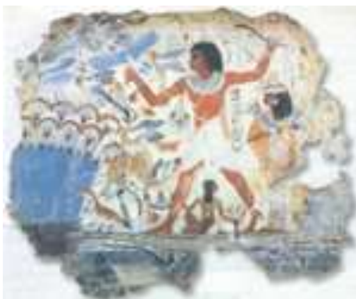
Εικ. 1: Τοιχογραφία από το ταφικό μνημείο Νε΄αμουίν στη Θήβα της Αιγύπτου, 1417-1379 ΠΚΕ. Εμφανής η επίδραση του ύφους και της χρωματικής τόλμης της μινωικής ζωγραφικής.

Το συγκεκριμένο αιγαιοπελαγίτικο σκαρί, πρόγονος όλων των μεσογειακών σκαφών, βγαίνοντας με τόλμη στην ανοικτή θάλασσα, έκανε με την καρίνα του μια τομή στην ιστορία, επιταχύνοντας τον βηματισμό της. Το πνεύμα της περιπέτειας και το κυνήγι της τύχης –που οι Μυκηναίοι ασπάστηκαν πρόθυμα από τους Μινωίτες και τους Κυκλαδίτες– απελευθερωμένα μετά την τιθάσευση της ανοικτής θάλασσας, την μεταμόρφωσαν σε έναν οικείο χώρο ανταλλαγών κάθε είδους: αγαθά, γνώσεις, νοοτροπίες, τεχνικές, κοσμολογίες και δοξασίες γίνονται κτήμα κοινό, συστατικά μιας κοσμοπολίτικης κουλτούρας, στην οποία συνεισφέρουν όλοι. Μια περίοδος ειρηνικών ανταλλαγών ξεδιπλώνεται πριν από τα μέσα της 2ης χιλιετίας ΠΚΕ, στενά δεμένη με την περιπέτεια του μετάλλου που την καθορίζει, του χαλκού.