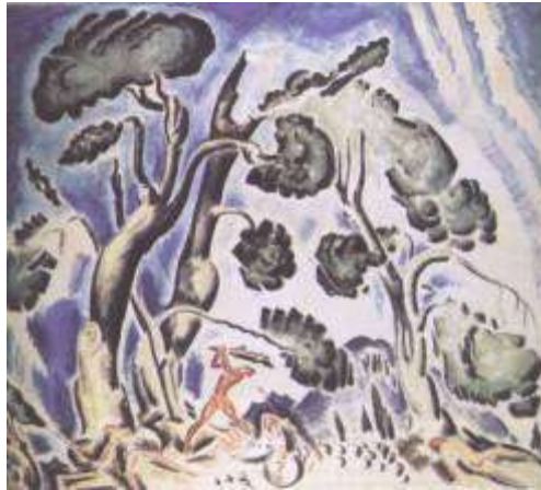
Εικ. 5. Κωνσταντίνος Παρθένης, Μάχη του Ηρακλή με τις Αμαζόνες, Εθνική Πινακοθήκη

Στον καλλιτεχνικό χώρο η «ακαδημαϊκή» ζωγραφική έδωσε σταδιακά τη θέση της σε καλλιτέχνες που έρχονταν σε επαφή με τις νέες τάσεις. Οι καλλιτέχνες αυτοί επηρεάστηκαν από τα κινήματα του κυβισμού, του υπερρεαλισμού και του εξπρεσιονισμού, κινήματα που όριζαν με διαφορετικό τρόπο το καθένα τη θέση του ατόμου μέσα στον κόσμο. Πράγματι, μια από τις βασικές επιπτώσεις της βιομηχανικής επανάστασης είναι η ρήξη της κλειστής κοινωνικοοικονομικής και ιδεολογικής κοινότητας και η συγκέντρωση μεγάλου πληθυσμού στα συνεχώς επεκτεινόμενα αστικά βιομηχανικά κέντρα. Αυτό το γεγονός προκαλεί διφορούμενα συναισθήματα στον άνθρωπο, συναισθήματα απομόνωσης αλλά και ανεξαρτησίας, μοναξιάς αλλά και ελευθερίας, και καλείται πλέον αυτός να βιώσει τον εαυτό του ως άτομο, ως αυτόνομη φυσική αξία, και ως εκ τούτου να επανακαθορίσει τις σχέσεις του με τον κόσμο, άψυχο και έμψυχο, σχέσεις που μέχρι τώρα τις καθόριζε η κοινότητα και είχαν συλλογικό χαρακτήρα. Σε τελευταία ανάλυση, η μοντέρνα τέχνη δεν είναι τίποτα άλλο παρά η προσπάθεια που καταβάλλει το άτομο να αυτοκαθορισθεί ως αυτόνομο υποκείμενο[10].