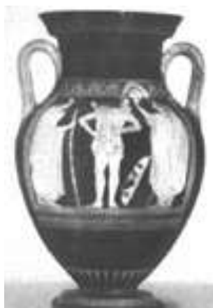
Εικ. 6: Αττικός ερυθρόμορφος αμφορέας του Ευθυμίδη, περίπου 510-500 ΠΚΕ

Ο μελανόμορφος ρυθμός είναι μια τεχνική αγγειογραφίας, που εφευρέθηκε από τους αγγειογράφους της μέσης πρωτοκορινθιακής περιόδου (690-650 ΠΚΕ.) και τελειοποιήθηκε από τους αττικούς αγγειογράφους του βου αι. ΠΚΕ.[35]. Το σώμα του αγγείου παραμένει στο χρώμα του πηλού και η διακόσμηση γίνεται με μελανή σκιαγράφιση για να αποδοθούν οι μορφές[36], ενώ οι λεπτομέρειες χαράσσονταν πριν το ψήσιμο με οξύ εργαλείο που απομάκρυνε το μαύρο γάνωμα στα σημεία της χάραξης[37]. Στον ερυθρόμορφο ρυθμό, που χρησιμοποιήθηκε για πρώτη φορά από τον ζωγράφο του Ανδοκίδη στην Αθήνα γύρω στο 525 ΠΚΕ[38], η τεχνική είναι ακριβώς η αντίστροφη του μελανόμορφου. Εδώ το αγγείο βάφεται μαύρο, ενώ οι μορφές παραμένουν ανοιχτόχρωμες – στο χρώμα του πηλού – και οι λεπτομέρειες αποδίδονται σχεδιαστικά[39]. Χρησιμοποιώντας τα παραδείγματα των αγγείων που παραθέτουμε, ευθυγραμμίζομαστε με την άποψη του Πλάντζου ότι «ο ερυθρόμορφος ρυθμός, αν και βασισμένος, όπως και ο μελανόμορφος, σε σχεδιαστικές συμβάσεις, ευνοεί τη φυσιοκρατική απόδοση των θεμάτων του»[40].