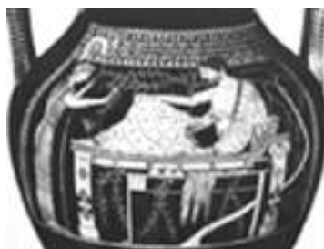
Εικ. 8: Η ερυθρόμορφη όψη του αγγείου της εικ. 7.

Στην πλευρά με την μελανόμορφη παράσταση υπάρχουν άλλες δύο αντρικές μορφές. Εδώ γίνονται πλέον εύκολα αντιληπτές μερικές από τις δυνατότητες που είχε η ερυθρόμορφη τεχνική. Αρχικά, αποδίδονται οι ανθρώπινες μορφές στο «φυσικό» χρώμα του δέρματος. Αυτό βοηθάει στην μεγαλύτερη εκφραστικότητα των προσώπων και των κινήσεων[45]. Για παράδειγμα, στην ερυθρόμορφη παράσταση διακρίνουμε την θεά Αθηνά να χαμογελά και να προσφέρει όλο χάρη ένα άνθος στον Ηρακλή, λεπτομέρειες που χάνονται στην μελανόμορφη παράσταση. Κατόπιν, με την χρησιμοποίηση πινέλων διαφορετικού πάχους αποδίδονται γραμμές λεπτότερες ή παχύτερες, υπογραμμίζοντας έτσι με διαφορετική ένταση τις λεπτομέρειες[46]. Τέλος, με την χρήση αραιωμένου γανώματος για την παράσταση των μαλλιών, το τρίχωμα του κορμού, την απόδοση των μυών (λ.χ. η γενειάδα του Ηρακλή), και με την σχεδίαση ανάγλυφων γραμμών στα περιγράμματα των μορφών, επιτυγχάνονταν μεγαλύτερη φυσικότητα[47].