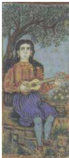
Εικ. 8. Θεόφιλος

τη μορφή συμβόλου, που μάχεται σθεναρά ό,τι δυτικότερο τείνει να αποδεχθεί η ελληνική τέχνη αυτής της περιόδου (βλ. εικ.7)[14].