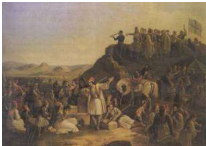
Εικ. 3. Θεόδωρος Βρυζάκης, Το στρατόπεδο του Καραϊσκάκη στην Καστέλα, Εθνική Πινακοθήκη.

Κατά τη διάρκεια της βασιλείας του Όθωνα, λόγω των συγγενικών δεσμών που συνέδεαν τη βασιλική οικογένεια της Ελλάδας με αυτή της Βαυαρίας, το Μόναχο προσελκύει τους Έλληνες καλλιτέχνες, που σπουδάζουν κοντά στους μεγάλους δασκάλους της Βασιλικής Ακαδημίας των Εικαστικών Τεχνών και συνδέονται με τη Σχολή του Μονάχου.