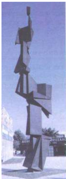
Εικ. 12. Γιώργος Ζογγολόπουλος, Υπαίθριο γλυπτό, Ίδρυμα Νιάρχου

κηλίδες ενδιάμεσων τόνων από το φωτεινό στο σκούρο χωρίς τα ακραία τους σημεία. Τα χρώματα είναι συμπληρωματικά – ανήκουν στην περιοχή του κόκκινου και του πράσινου με συνέπεια την ψυχολογική αρμονική εντύπωση. Τέλος, ρυθμό δίνουν στο έργο οι εναλλαγές των μεγάλων με τις μικρές χρωματικές περιοχές, ο κύκλος που θυμίζει πανσέληνο πίσω από σύννεφα και η μονή πινελιά ανάμεσα στο πάνω και το κάτω τμήμα»[21].