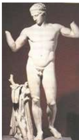
Εικ. 4: Ο Διαδούμενος του Πολυκλείτου, περίπου 440-420 ΠΚΕ.

Επίσης, παρατηρούμε ότι το γλυπτό υπακούει στους νόμους της αρχαϊκής πλαστικής [26]. Κατ' αρχήν η μορφή πειθαρχεί στο νόμο της μετωπικότητας, καθώς υπάρχει απόλυτη αναλογία (συμμετρία) μεταξύ των ανατομικών λεπτομερειών των δύο ίσων μερών, που λαμβάνονται, αν φέρουμε έναν νοητό κατακόρυφο άξονα στο κέντρο της. Επίσης εύκολα αναγνωρίζουμε την τυποποιημένη μορφή ενός κούρου. Νέος, όμορφος, δυνατός και ρωμαλέος, αποτελεί «την πρότυπη, ιδεώδη, ανδρική μορφή της εποχής του»[27]. Έπειτα, παρατηρούμε ότι οι επιμέρους ανατομικές λεπτομέρειες αποδίδονται σχηματικά και όχι νατουραλιστικά. Για παράδειγμα, το κάτω μέρος των οφθαλμών είναι σχεδόν ευθύγραμμο και το επάνω βλέφαρο είναι καμπύλο. Η περιοχή της κοιλιακής χώρας περιγράφεται από έναν νοητό ρόμβο που αποτελείται από τις γραμμές του θωρακικού διαφράγματος, που σχηματίζουν μια οξεία κορυφή, και τους ευθύγραμμους βουβωνικούς αύλακες κ.λπ. Τέλος, διακοσμητικά στοιχεία ανακαλύπτουμε κυρίως στην κόμη.