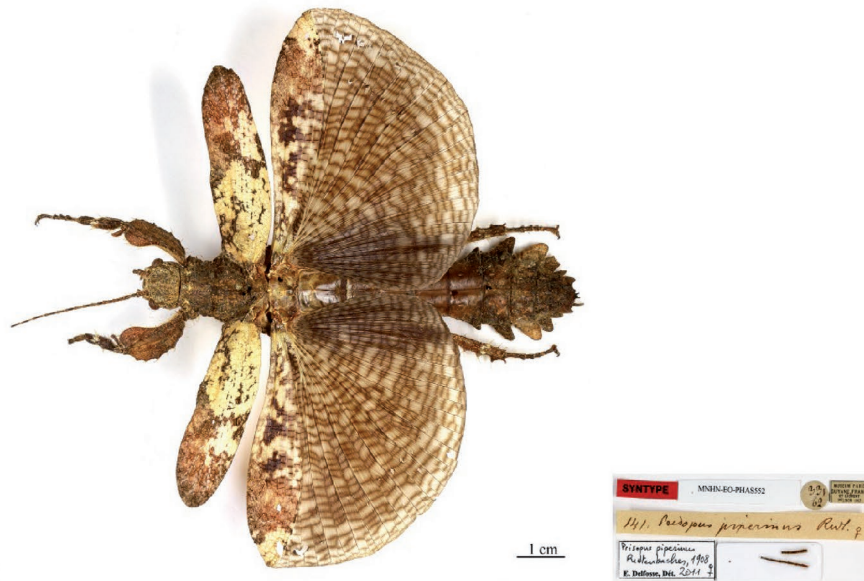
Syntype de Prisopus piperinus Redtenbacher, 1906 (MNHN-EO-PHAS552)