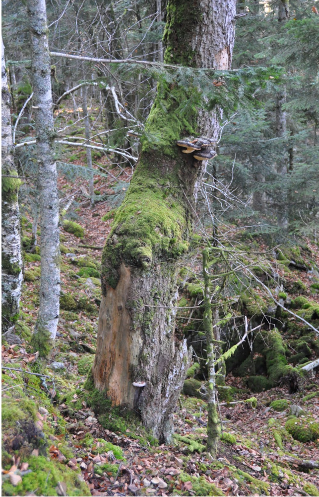
Fig. 1. — Habitat de Peltis grossa (Linnaeus, 1758), Pyrénées (France).