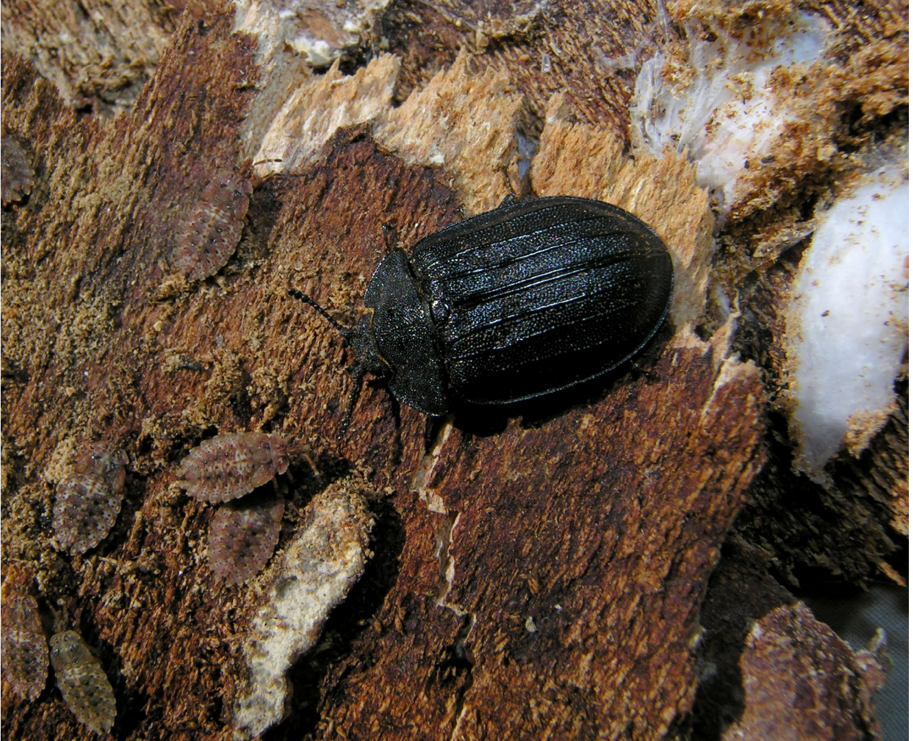
Fig. 2. — Imago de Peltis grossa (Linnaeus, 1758) et larves d'Aradidae (Hémiptères), Gorges de la Rhue, Cantal (France), 15 juillet 2010.