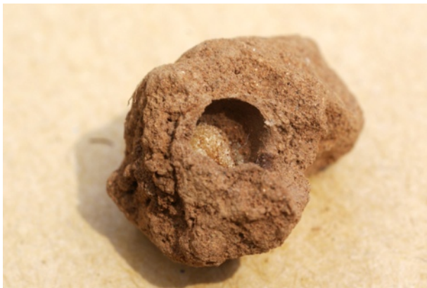
Figure 3b. Nid d' Hoplitis tenuiserrata (596) après son ouverture : on voit bien la « boule » pollinique.

Le pollen provient du Lotier ( Lotus corniculatus ) cité précédemment. La collecte de ce pollen est caractéristique de ce petit groupe d' Hoplitis qui est certainement oligolectique sur Fabaceae avec une forte préférence pour les Loteae (ROZEN et al. , 2009 - SÉDIVY et al. , 2013a). La cellule sera cloisonnée de terre, ainsi que le nid.