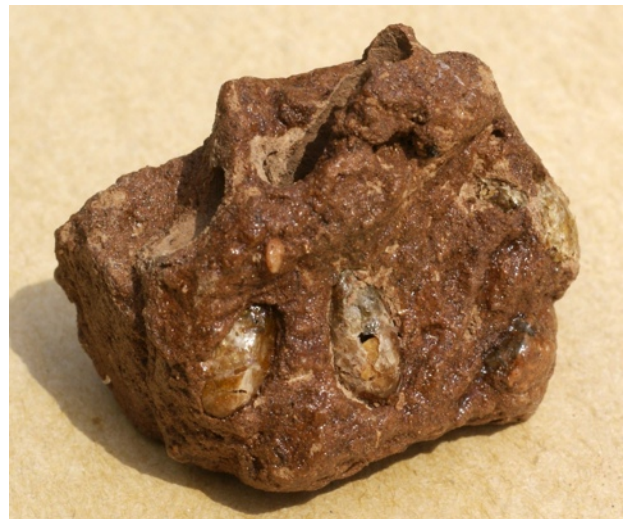
Figure 2b. Nid d' Hoplitis zaianorum (N597) dégagé du bloc de terre. Le contenu de la cellule 2 a été examiné pour identifier le pollen. La cellule 5, en construction, est ouverte pour en voir la structure.

La loge est tapissée de découpes de pétales de Lotus corniculatus abondant en bordure de route et en plaques dans le champ. La pâte pollinique sur laquelle l'œuf est pondu, occupe presque la moitié de l'espace cellulaire. Elle est élaborée à partir de pollen de Centaurée (très certainement C. solticialis présente plus à l'intérieur du champ). Cela m'a été confirmé par Andreas Müller à qui j'ai envoyé le contenu d'une des cellules pour examen (figure 2b).