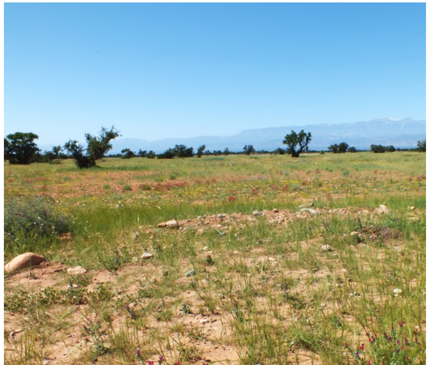
Figure 1. Site de collecte des deux nids dans la vallée du Souss, près du village de Tiout. Le champ est planté de blé très épars et de quelques arganiers, à de nombreux endroits le sol est à nu. Diverses plantes sont aussi présentes sur le site, comme de Echium plantagineum , du Lotus corniculatus , de la Centaurea solticialis , etc...

C'est en prospectant un champ en bord de route, un peu avant le village de Tiout, que j'ai eu la chance de découvrir deux nids en construction et capturer leur fondatrice respective (figure 1).