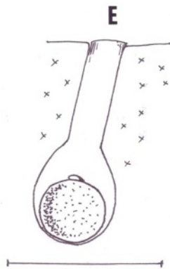
Figure 3a. Schéma du nid d' Hoplitis tenuiserrata (N596). Échelle 10 mm. Dessin : Gérard Le Goff

même le fond de la cellule. Cette réserve forme une boule qui occupe les 2/3 de la loge (figure 3b). L'œuf est pondu à son sommet.