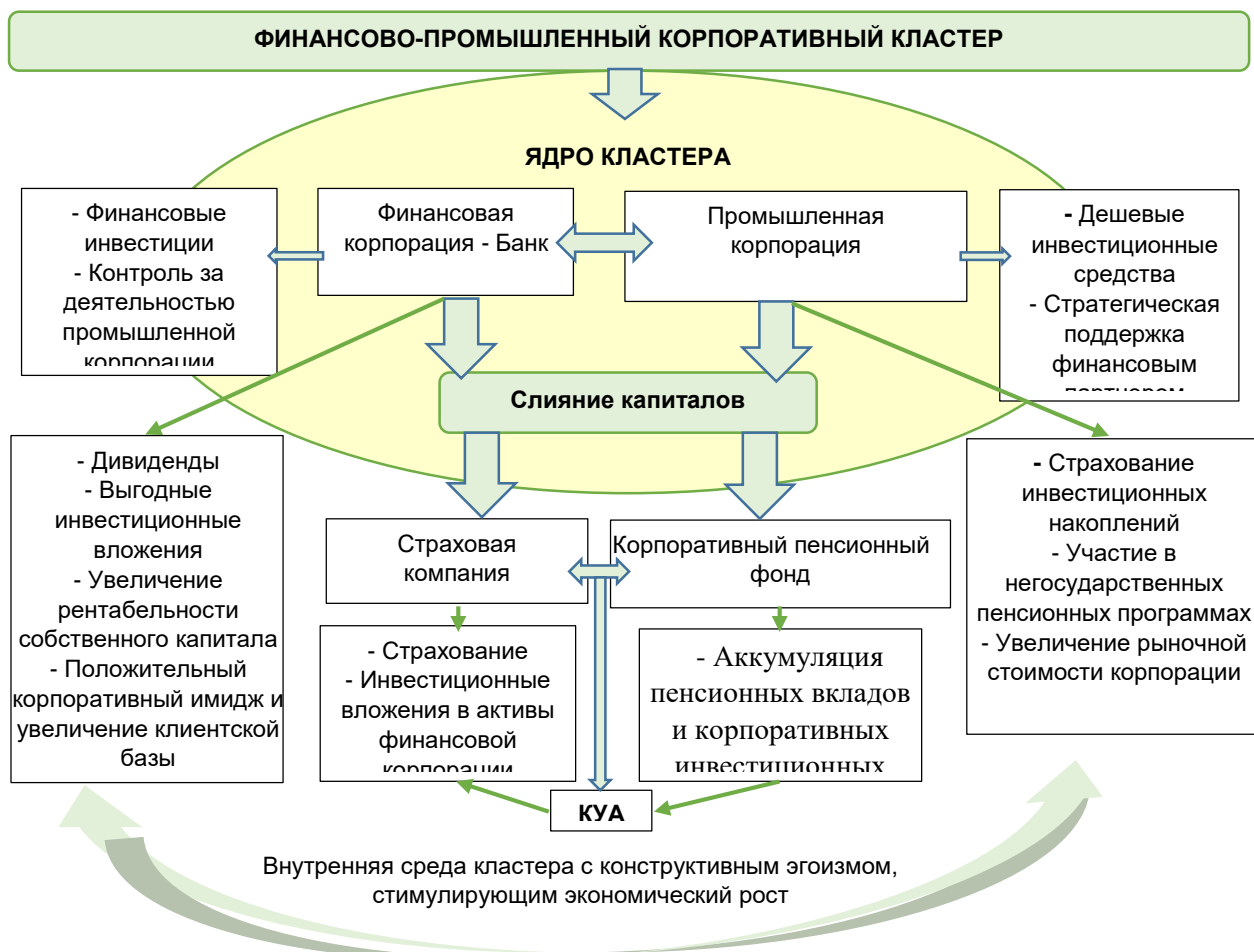
Рисунок 2. Модель корпоративного финансово-промышленного кластера [авторская разработка]

Предположим, старые акционеры оказывают сопротивление и не желают «размывать» часть своих корпоративных прав, делясь ими с новым собственником. В таком случае мы рекомендуем попробовать не корпоративную, а организационную модель ведения совместного бизнеса финансово-промышленных корпораций, каковой является кластер. Со временем в процессе совместной деятельности деструктивный экономический эгоизм с большой вероятностью трансформируется в конструктивный, что станет побудительным мотивом слияния корпоративного капитала. В этом случае целесообразно включить в состав кластера такие финансовые корпорации как страховую компанию, корпоративный пенсионный фонд и компанию по управлению активами (КУА) (рис. 1).