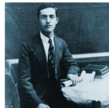
Γιωσήφ Ελιγιά

Ελιγιά Γιωσήφ (Ιωσήφ Ελία Ιωσήφ, πραγματικό όνομα Ιωσήφ Ηλία Καπούλιας· 30 Οκτωβρίου 1901, Ιωάννινα-29 Ιουλίου 1931, Αθήνα). Ελληνοεβραίος (Ρωμανιώτης) ποιητής, μελετητής και μεταφραστής. Μοναχοπαίδι μικροαστικής οικογένειας, ο Ελιγιά από μικρός έμεινε ορφανός από πατέρα. Αποφοίτησε από το γαλλόφωνο γυμνάσιο της Alliance Israélite Universelle των Ιωαννίνων, στην πόλη όπου πέρασε τα παιδικά και νεανικά του χρόνια, και διορίστηκε καθηγητής το 1919 στο ίδιο σχολείο για μία εξαετία. Αρχικώς έλαβε ενεργό μέρος στη σιωνιστική κίνηση της