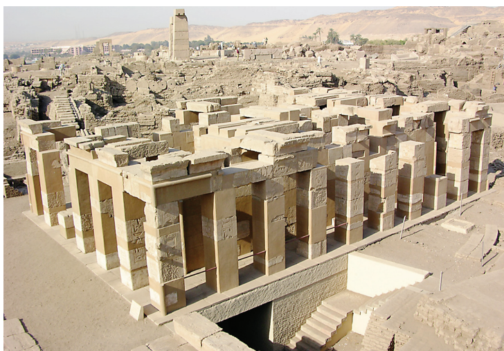
Αιγυπτιακός ναός στη νήσο Ελεφαντίνη

Porten, B., "The Structure and Orientation of the Jewish Temple at Elephantine-A Revised