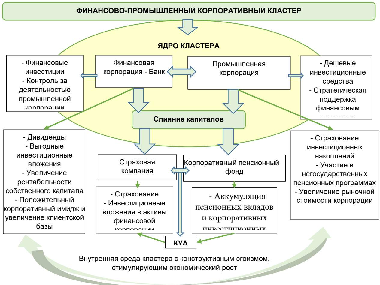
Рисунок 2. Модель корпоративного финансово-промышленного кластера [авторская разработка]

Предположим, старые акционеры оказывают сопротивление и не желают «размывать» часть своих корпоративных прав, делясь ими с новым собственником. В таком случае мы рекомендуем попробовать не корпоративную, а организационную модель ведения совместного бизнеса финансово-промышленных корпораций, каковой является кластер. Со временем в процессе совместной деятельности деструктивный экономический эгоизм с большой вероятностью трансформируется в конструктивный, что станет побудительным мотивом слияния корпоративного капитала. В этом случае целесообразно включить в состав кластера такие финансовые корпорации как страховую компанию, корпоративный пенсионный фонд и компанию по управлению активами (КУА) (рис. 1).